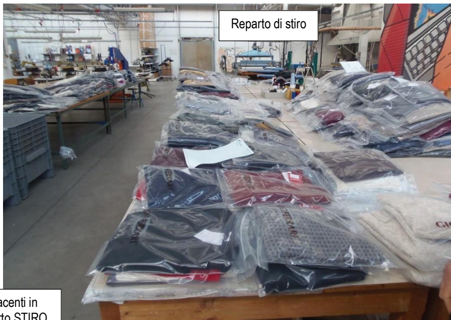
Reparto di stiro

Trattasi, secondo le dichiarazioni del ... omissis ... e con il supporto della documentazione ricevuta (vedi Allegato B ) di circa 2.000 capi. Questi sono stati visionati e fotografati all'interno del reparto di stiro ed in parte nei magazzini aziendali.