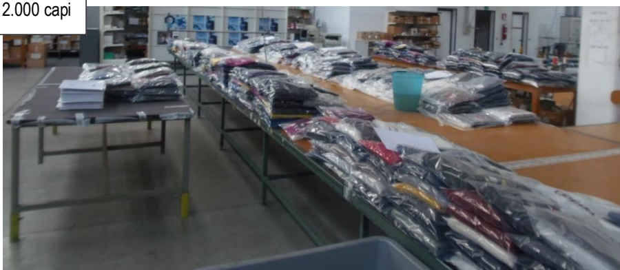
Giacenti in reparto STIRO circa 2.000 capi

Altri capi, sempre della stessa partita, sono in magazzino, rientrati dalla disponibilità di un ex agente (... omissis ...).