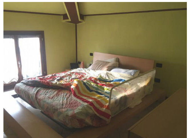
Vista camera da letto