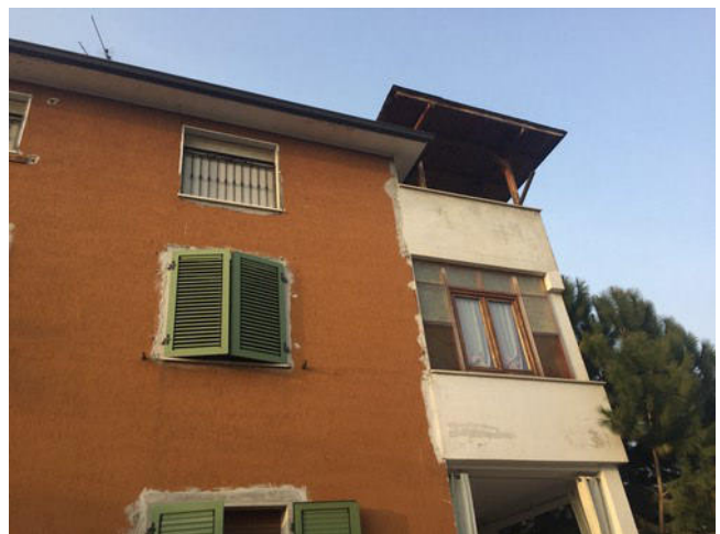
Vista del lato Sud appartamento sottotetto