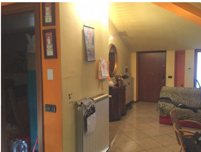
Vista del soggiorno dalla zona cottura