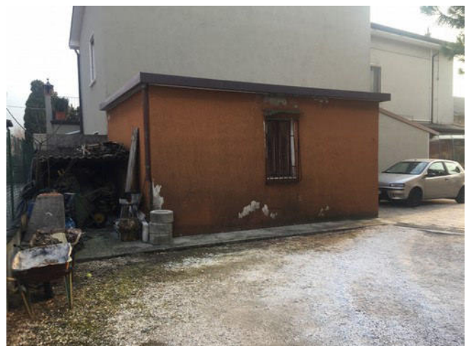
Vista della autorimessa (proprietà per ½) vista Nord