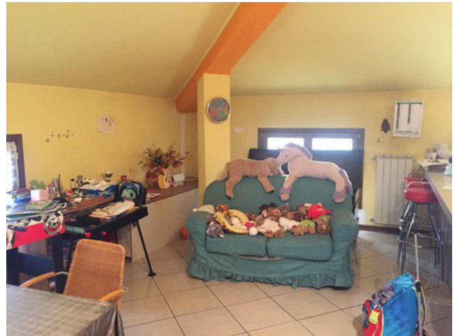
Vista del soggiorno verso la zona cottura