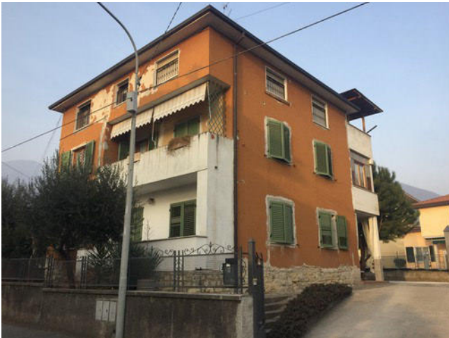
Vista dell'immobile dal Via Sacca n. 22 lato Sud Ovest