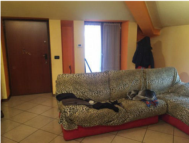
Vista del soggiorno con portoncino ingresso