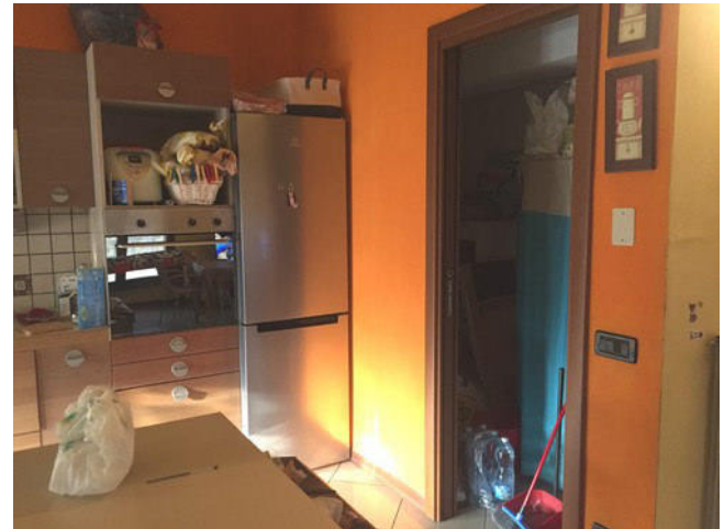
Vista della zona cottura con ripostiglio "non autorizzato"