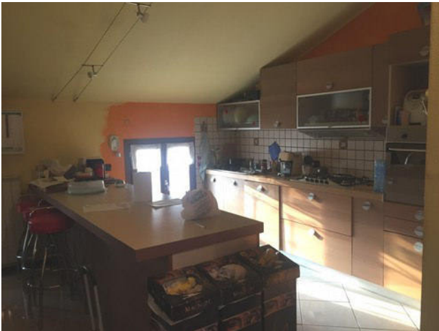
Vista della zona cottura con penisola