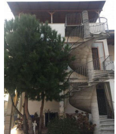
Vista lato Est con scala esterna