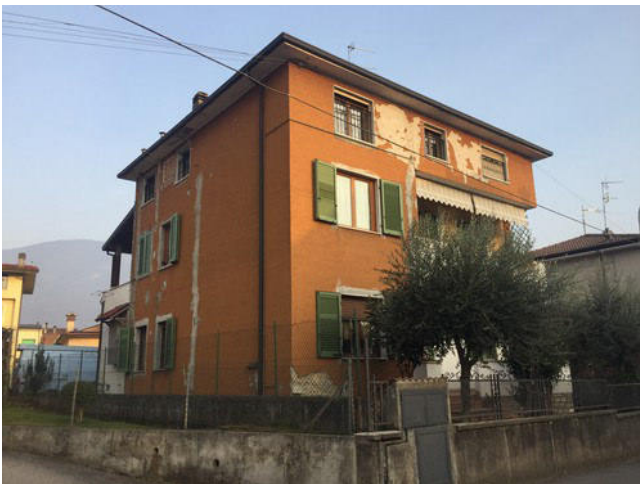
Vista dell'immobile dal Via Sacca n. 22 lato Nord Ovest