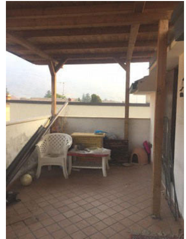
Vista della terrazza - tettoia "non autorizzata"