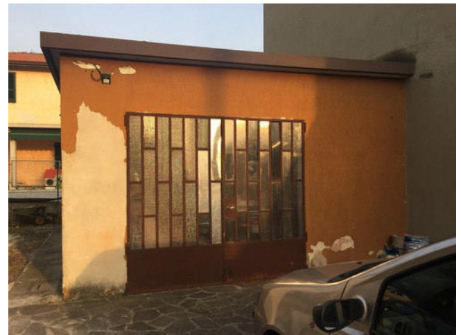
Vista della autorimessa (proprietà per ½) vista da Ovest.