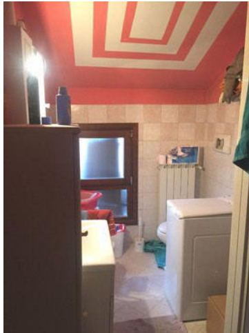
Vista del secondo bagno