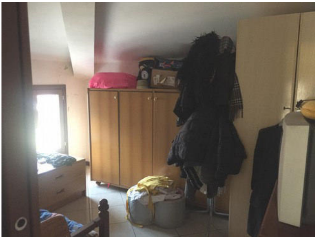
Vista della seconda camera da letto