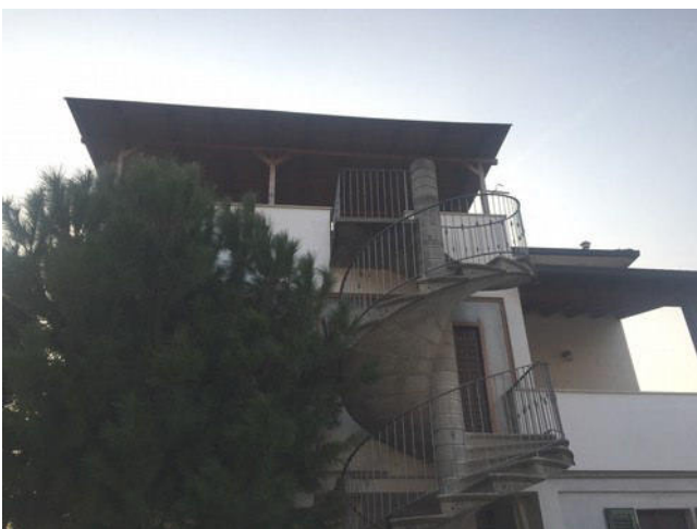
Vista dell'immobile dal cortile interno lato Est – scala esterna