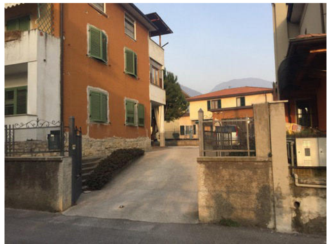
Vista dell' accesso carrabile e pedonale lato Sud Ovest.