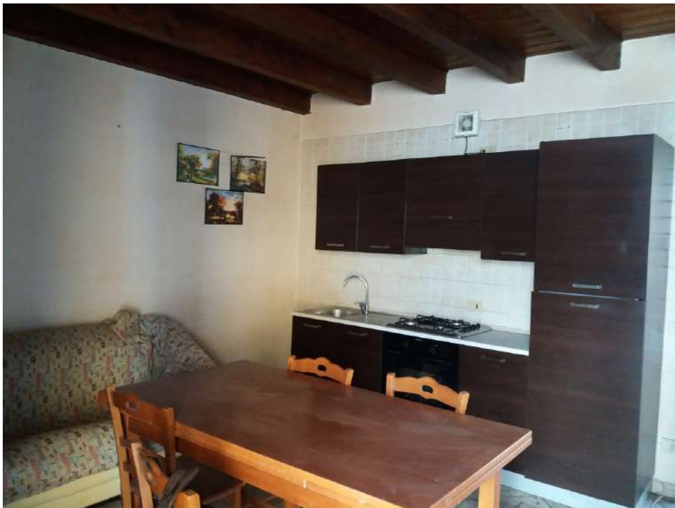
Fig. 10 – Piano terra: soggiorno-cucina