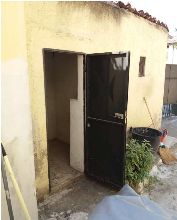
Fig. 21 Deposito con accesso dalla corte comune