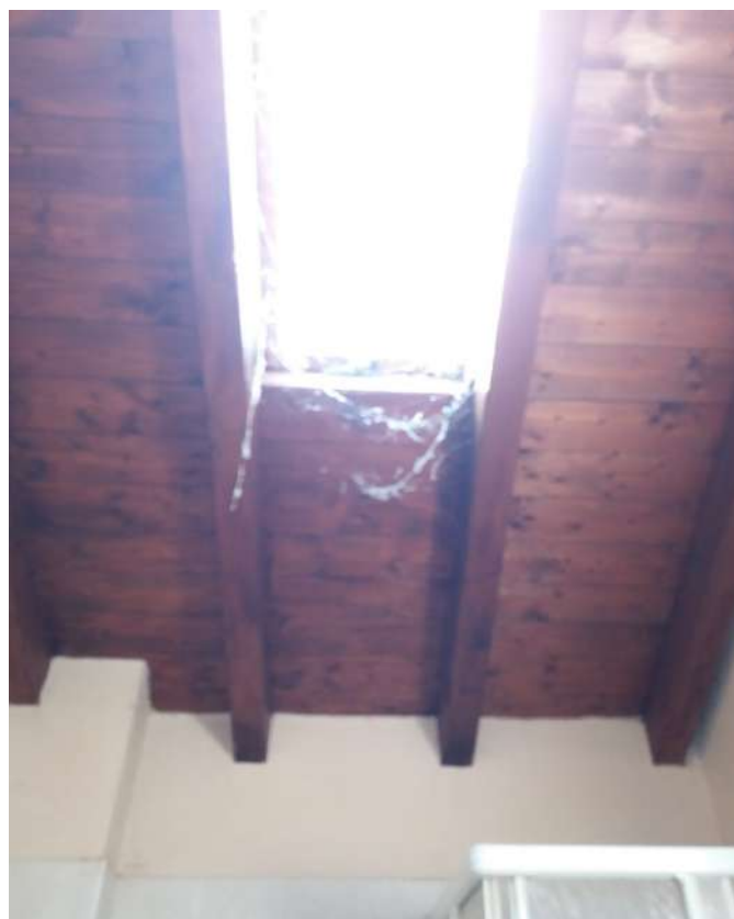
Fig. 17 – Piano primo: bagno