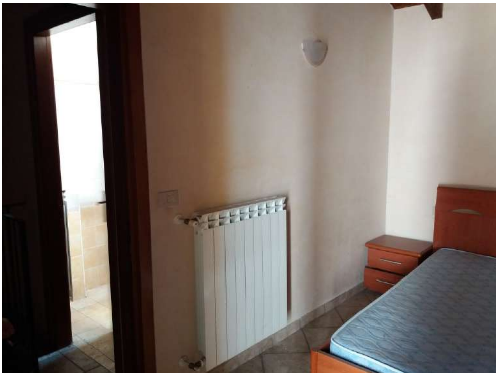
Fig. 19 – Piano primo: camera