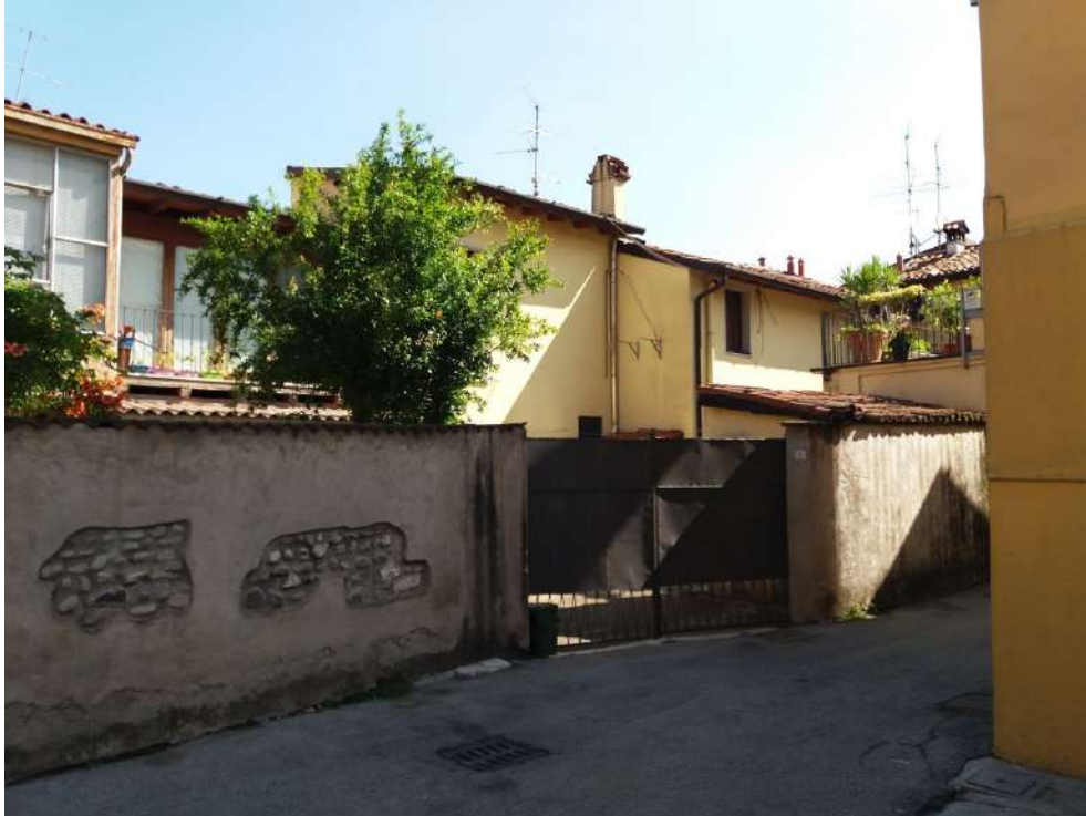
Fig. 06 – Corte interna osservata dall'esterno (Vicolo del Volto)