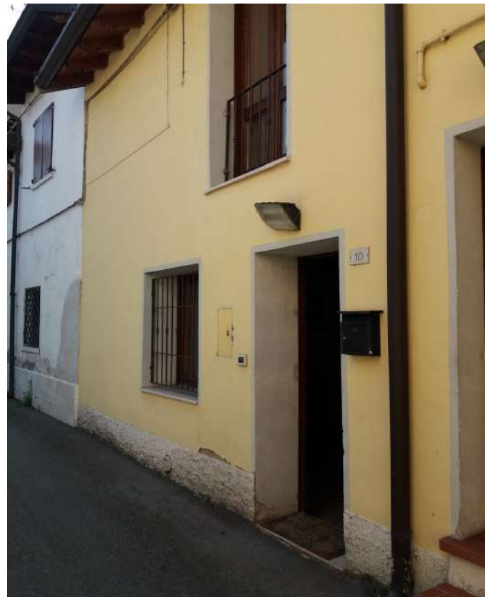
Fig. 05 –Accesso all'abitazione da V. Chiuso