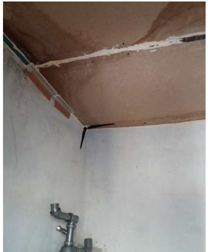
Fig. 22 - Deposito