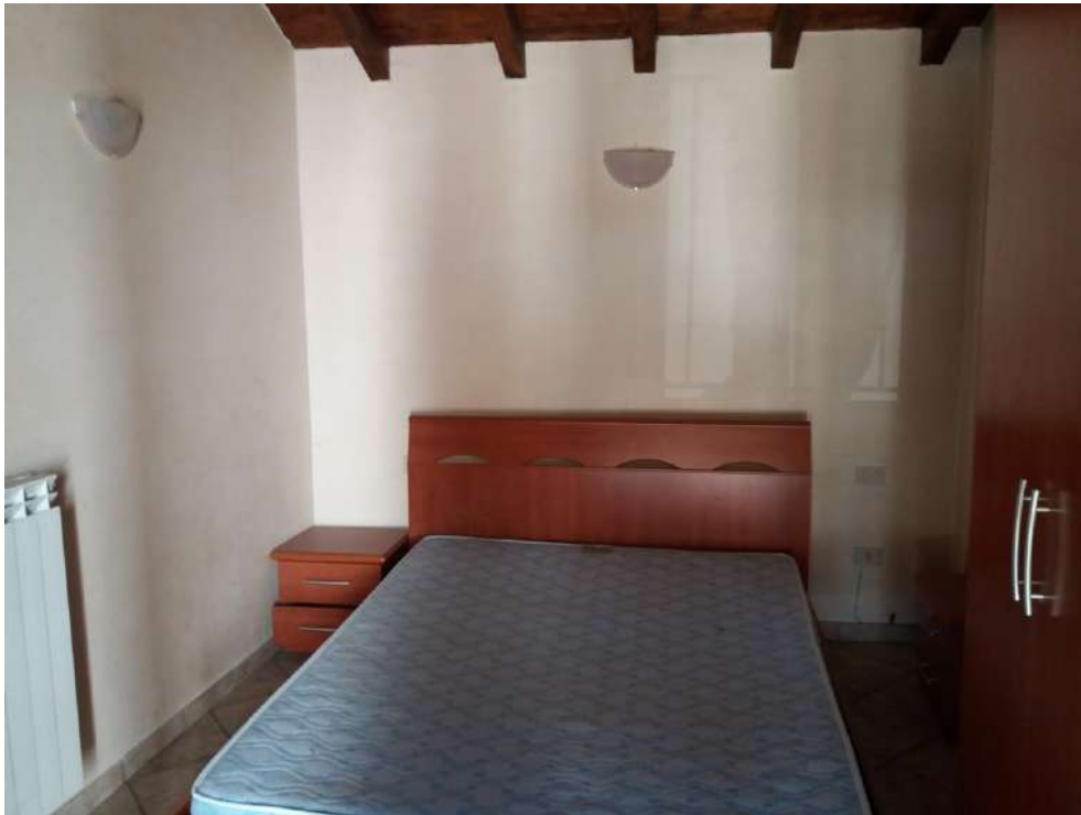
Fig. 18 – Piano primo: camera