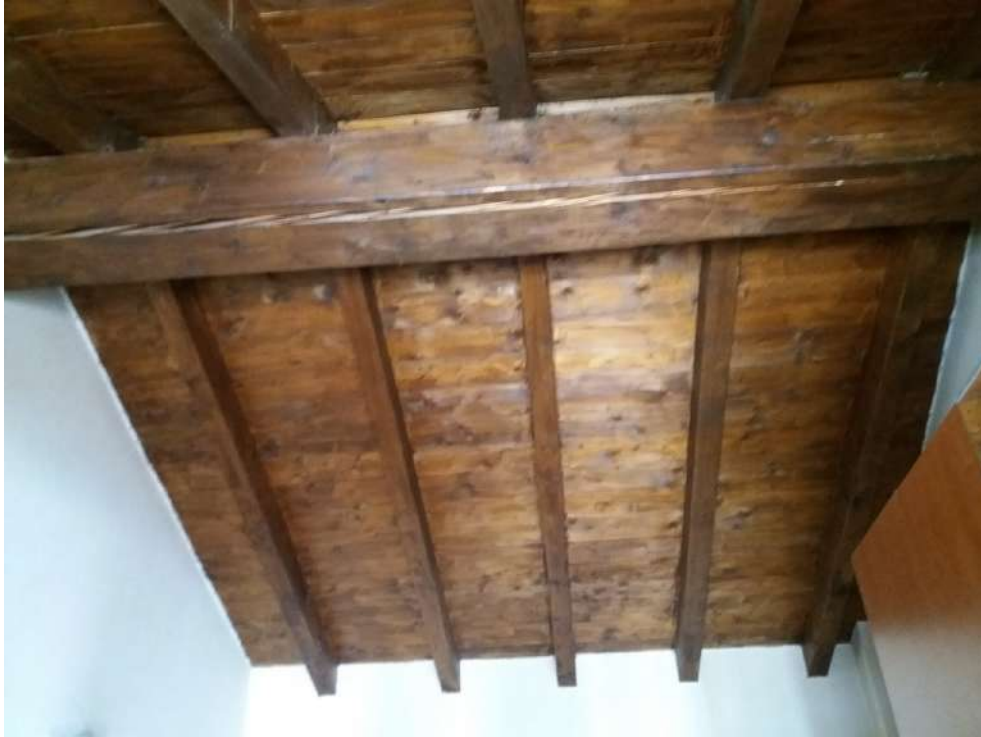
Fig. 20- Piano primo: camera