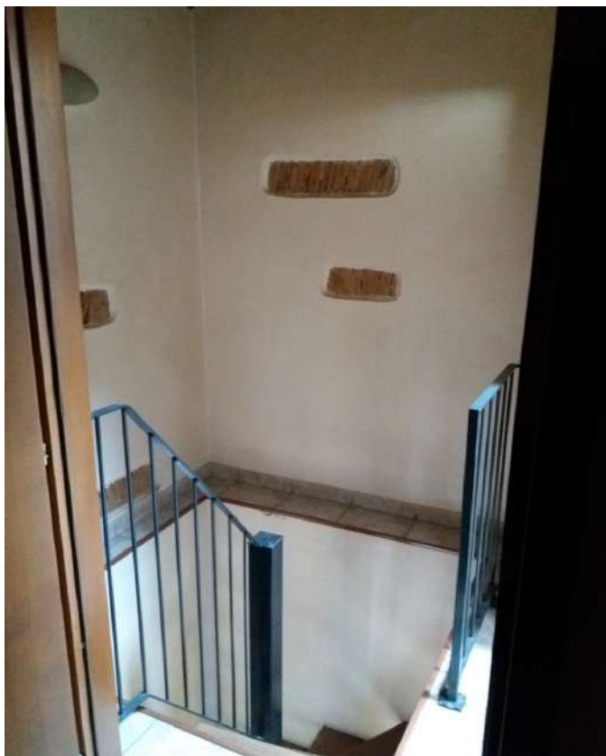
Fig. 14 – Piano primo: scala