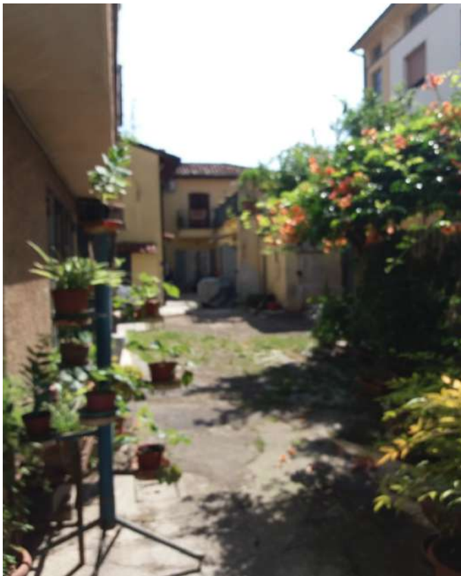
Fig. 07 – Corte interna comune