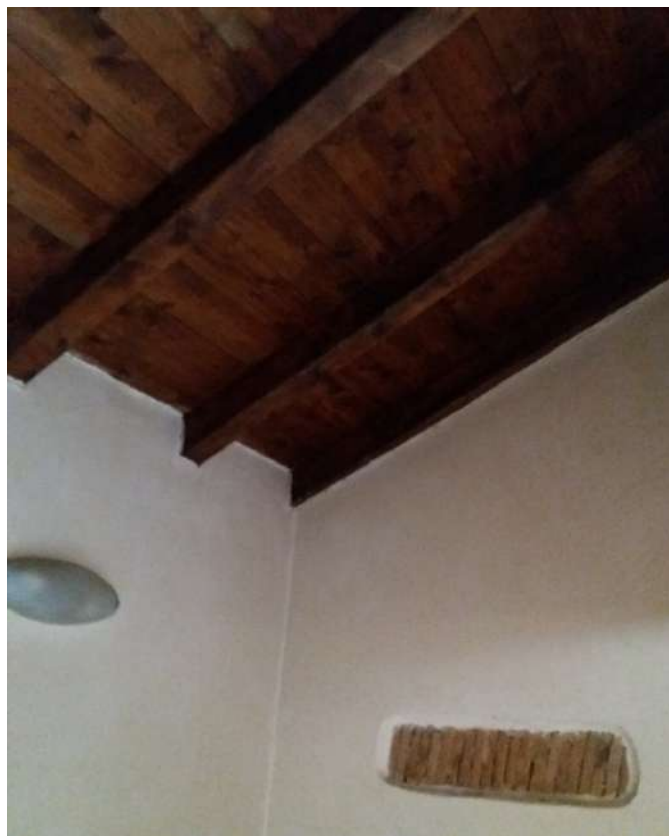
Fig. 15 –Piano primo: scala