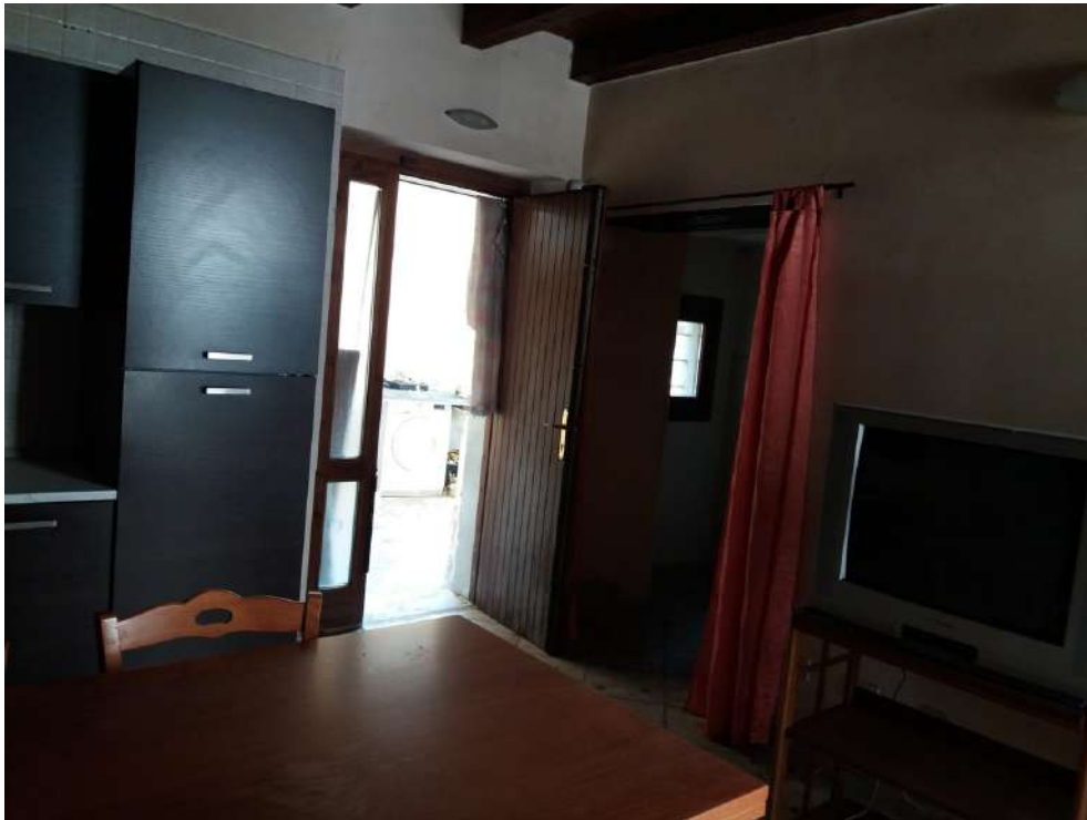
Fig. 11 – Piano terra: soggiorno-cucina