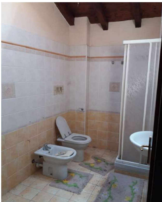
Fig. 16 – Piano primo: bagno