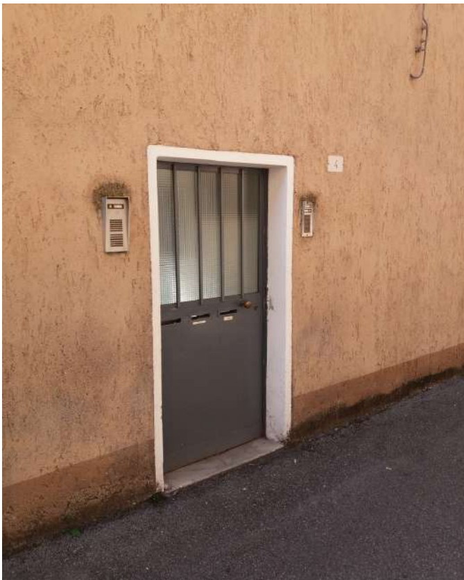
Fig. 04 –Accesso alla corte comune da V. Chiuso