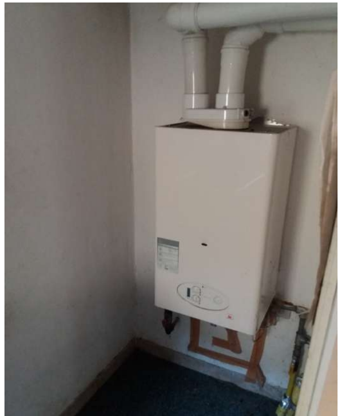
Fig. 13 – Piano terra: ripostiglio