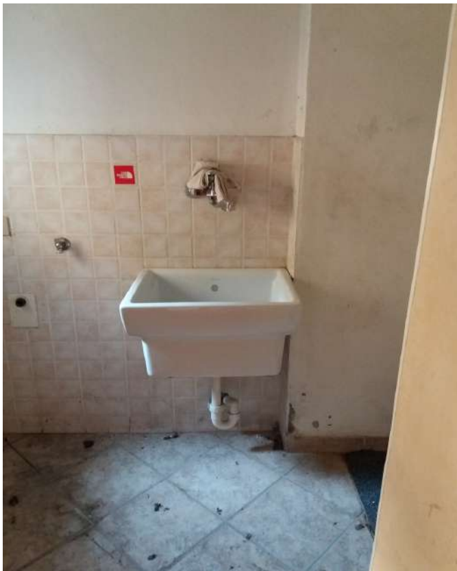
Fig. 12 – Piano terra: ripostiglio