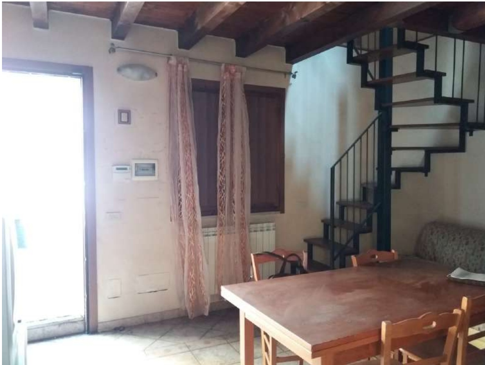
Fig. 09 – Piano terra: soggiorno-cucina