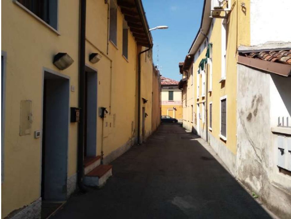
Fig. 03 – Vicolo chiuso visto guardando verso Via Cismondi