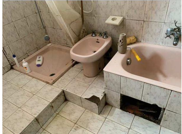
Fig. 6 e 7: Bagno