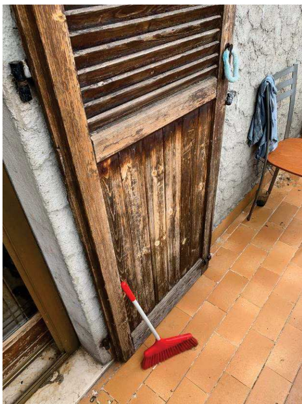
Fig. 11: Oscuranti esterni