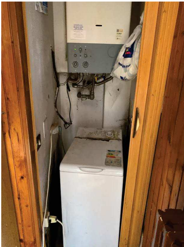
Fig. 8: Caldaia