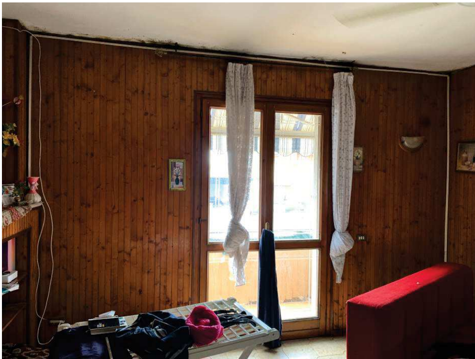
Fig. 3: Soggiorno