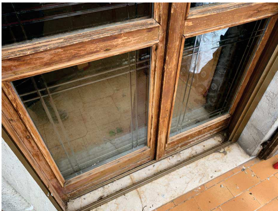
Fig. 10: Serramenti esterni