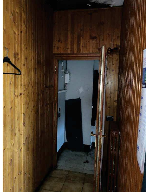
Fig. 2: Ingresso al piano primo