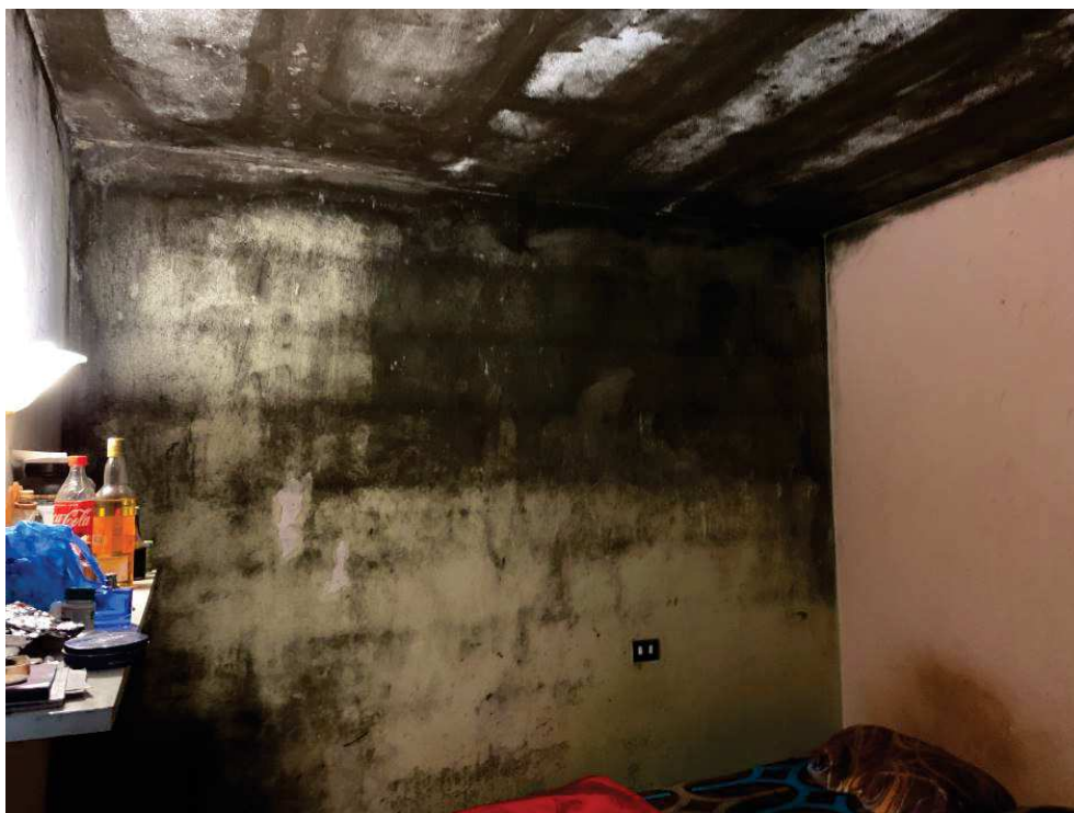
Fig. 4: Camera 1