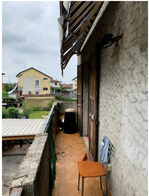
Fig. 9: Balcone