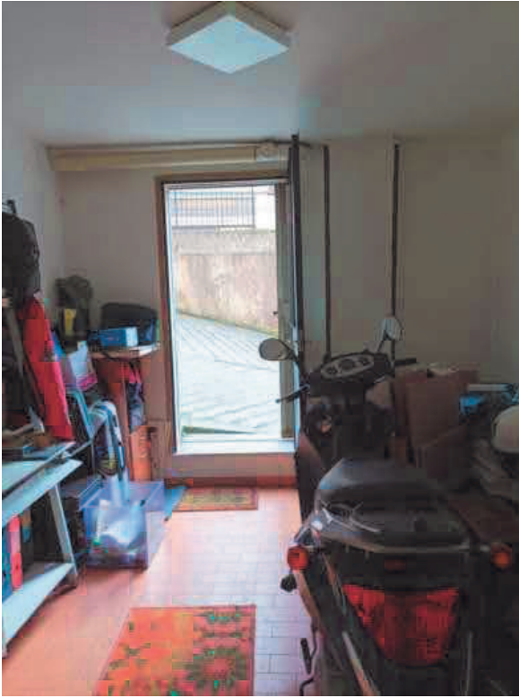
8. Vano in corrispondenza dell'accesso pedonale (atrio)