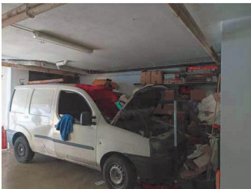
7. Interno con spazio a nord in corrispondenza della basculante n. 10