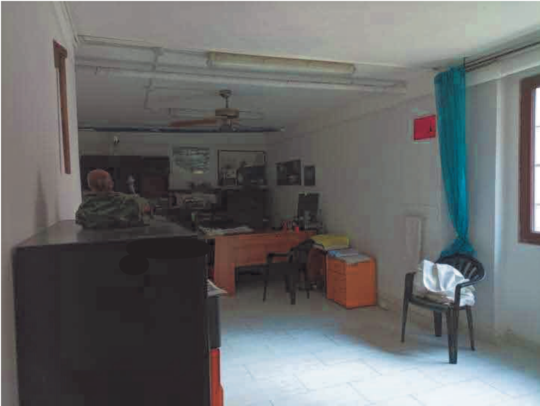
12. Vano destinato ad uso ufficio