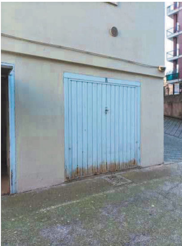
13. Basculante n. 8 tamponata internamente