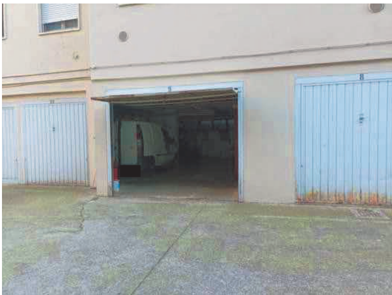
5. Le tre basculanti (n. 8, 9, 10) di accesso al deposito in lato ovest