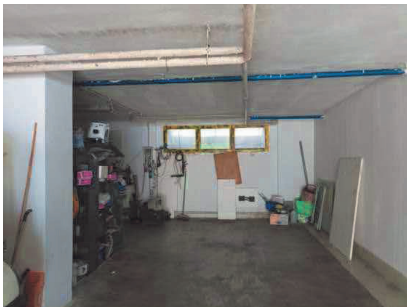
6. Interno zona deposito