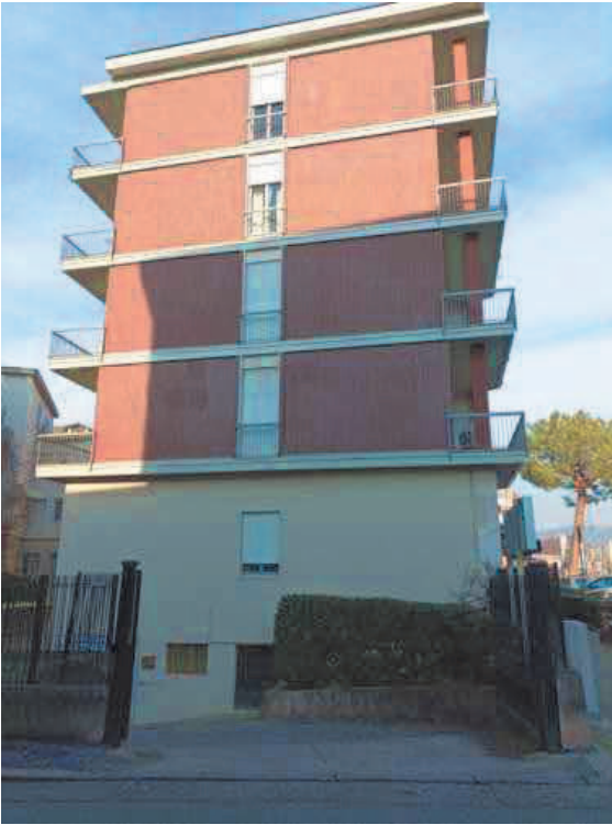
1. Prospetto sud con ingresso carrabile su Via Valgimigli Manara, 2