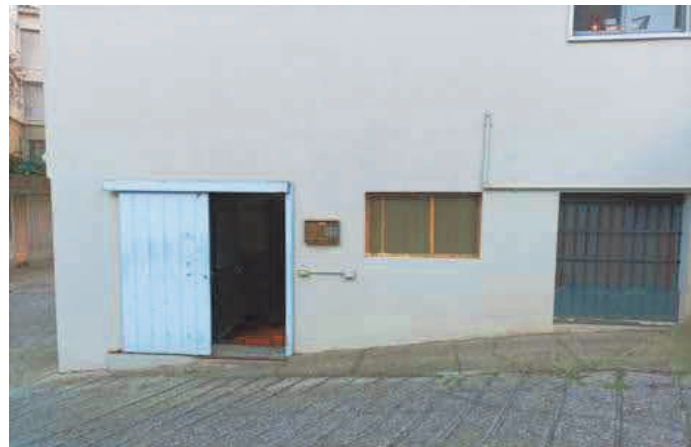
4. Accesso pedonale e prospetto in lato sud