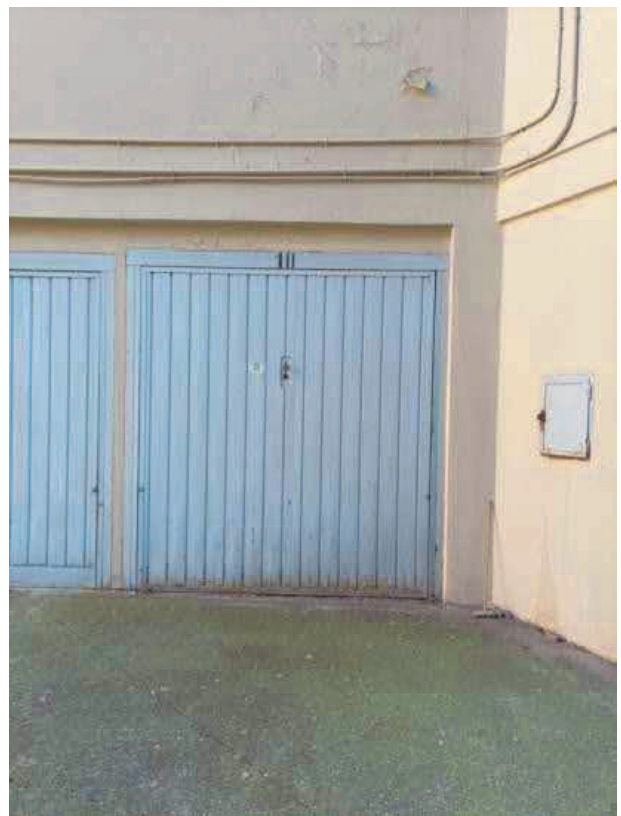
14. Basculante n. 10 non apribile