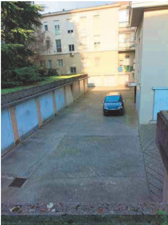
3. Il cortile visto dalla Via Valgimigli Manara