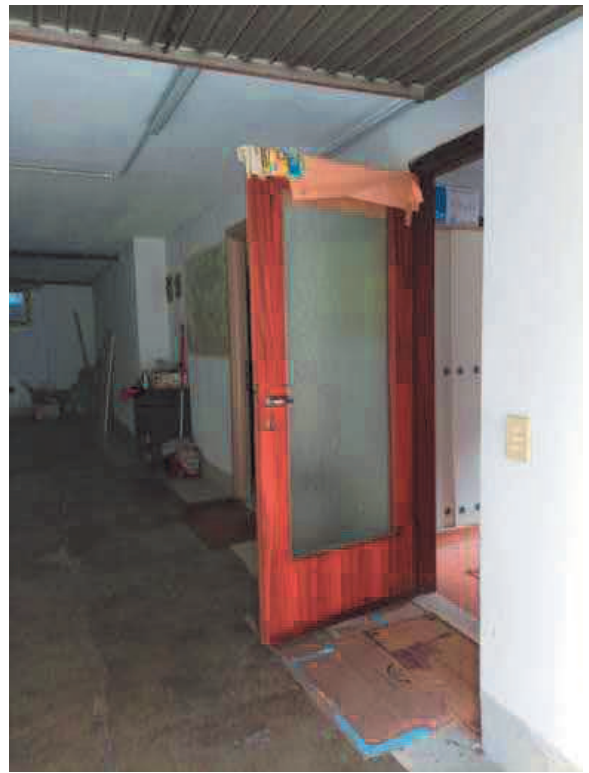
9. Parete con accesso all'ufficio e all'atrio