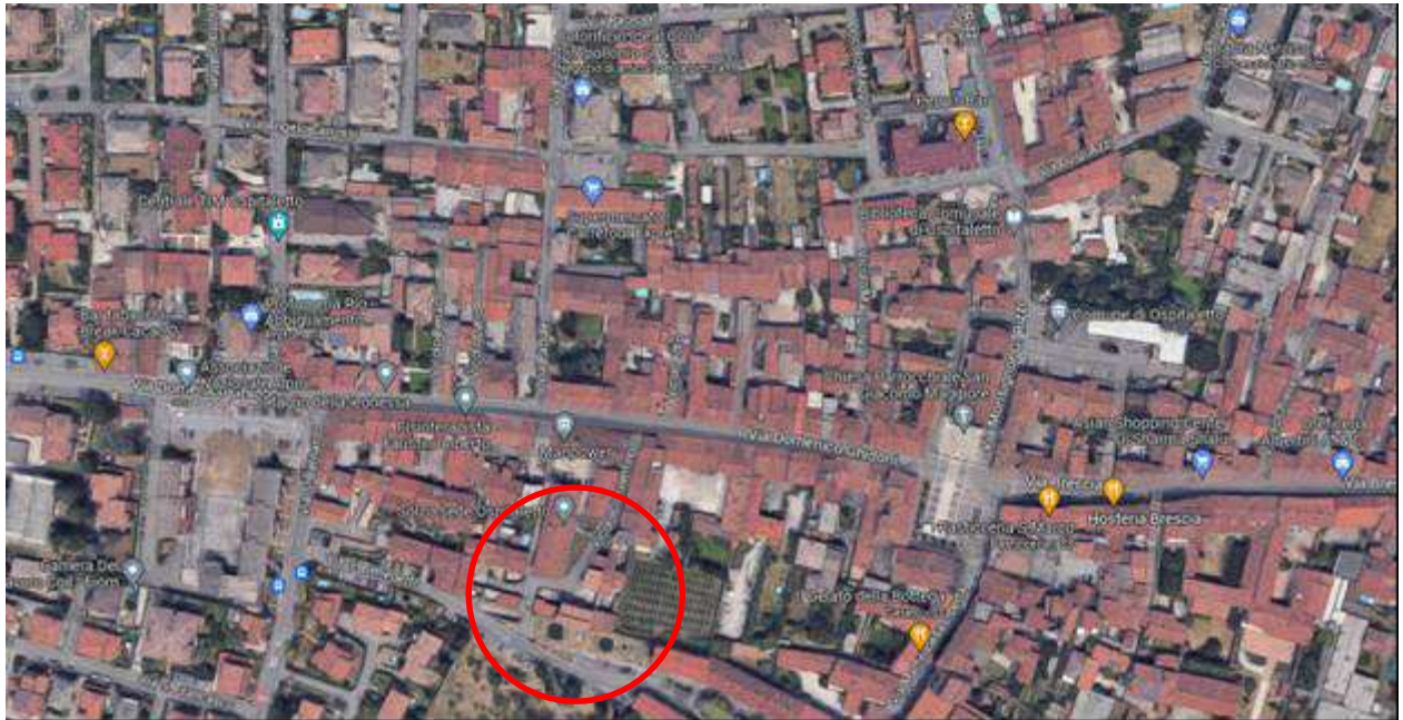
ubicazione fabbricato: vicolo Conventino

Conventino al civico 6, traversa di via Ghidoni e accesso carraio da via Ghidoni al civico 79.