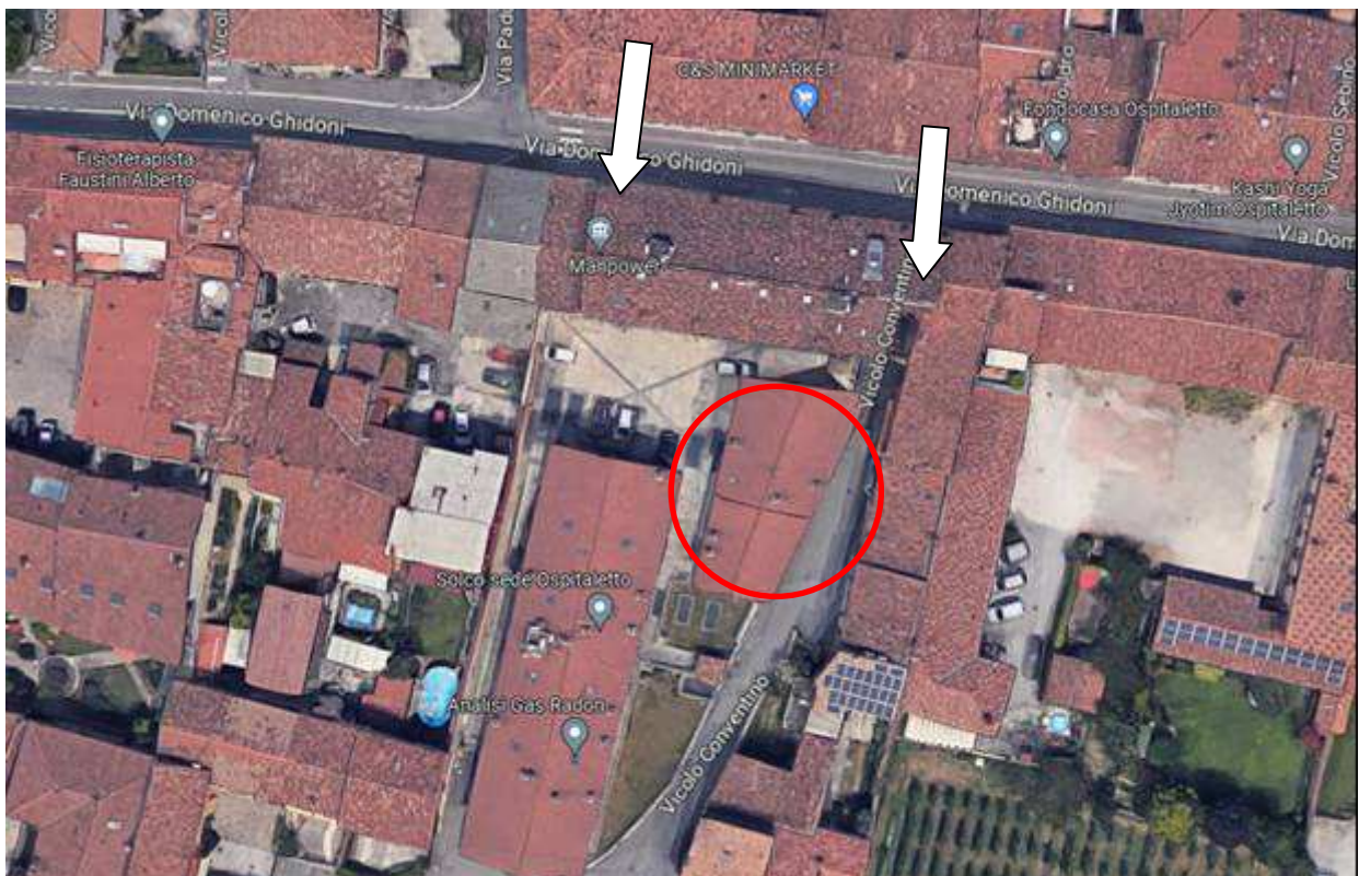
accesso da vicolo Conventino e da via Ghidoni

Dal cancello pedonale (vicolo Conventino 6/a) si accede alla corte comune (sub 65) in cui è sita la palazzina di n. 4 unità immobiliari.