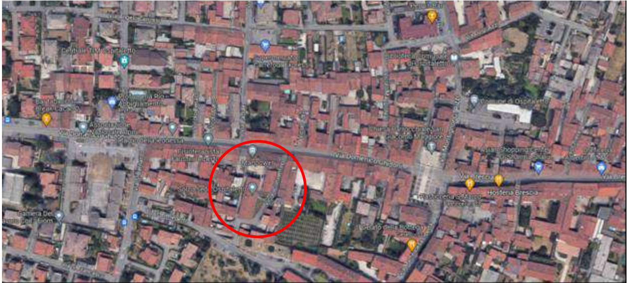
ubicazione fabbricato: vicolo Conventino