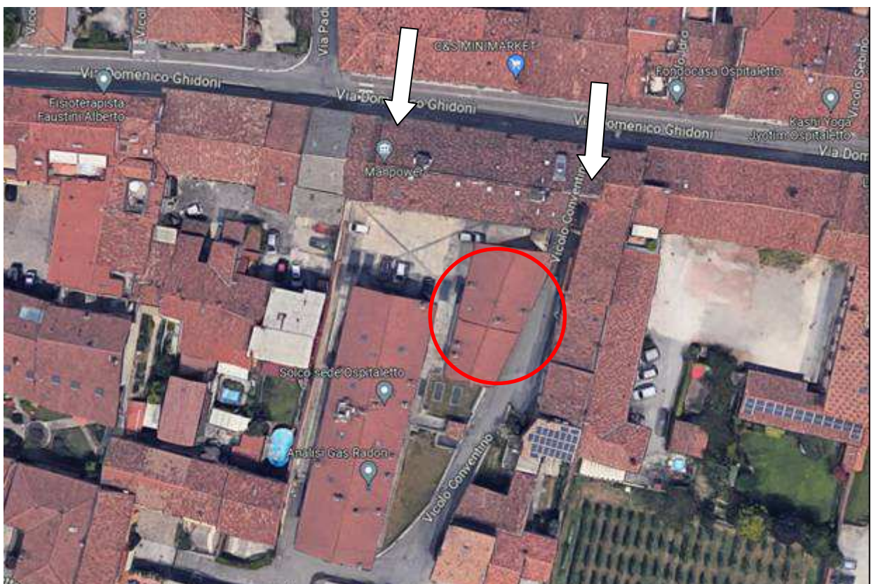
accesso da vicolo Conventino e da via Ghidoni