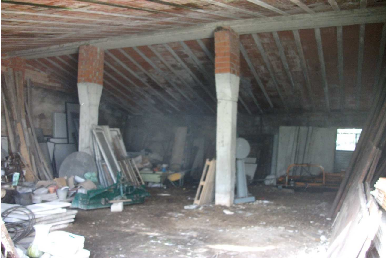
CABINE ELETTRICHE MAPP. 11114-11115