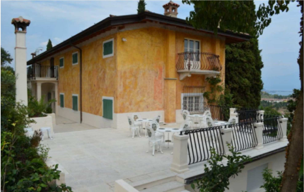
RETRO LATO OVEST AGRITURISMO E CASA PADRONALE