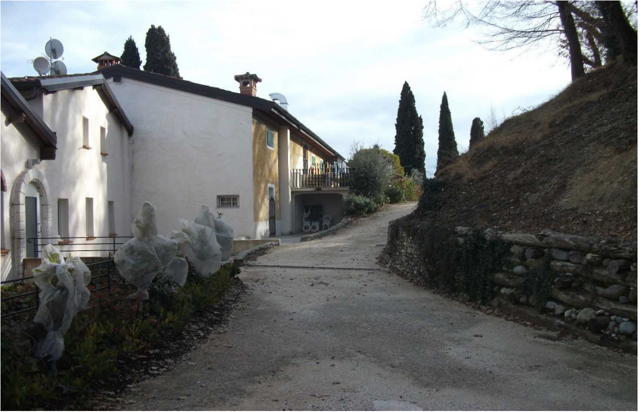
LATO NORD AGRITURISMO