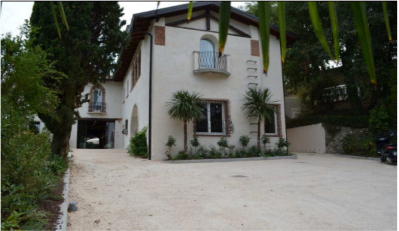
PARTE DI AGRITURISMO P.TERRA AL RUSTICO