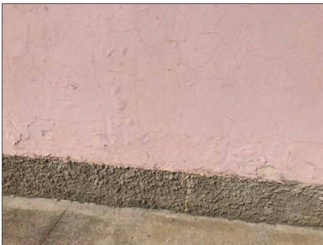
Fotografia 36 – Particolare del muro della facciata est, con distacchie sollevamento di tinteggiatura