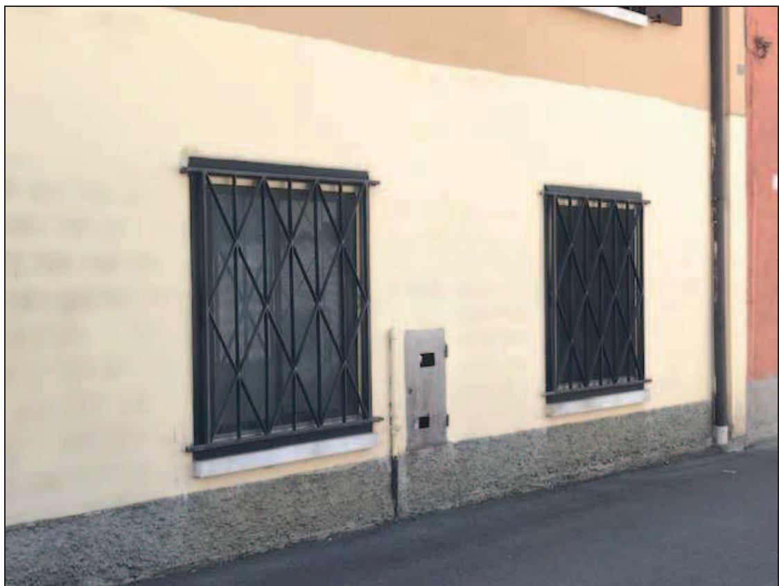
Fotografia 4 – Finestre su facciata nord

Immobile in Quinzano d'Oglio (BS), via Giacomo Matteotti n. 37 Catasto Fabbricati foglio NCT/8 particella 131 sub. 10