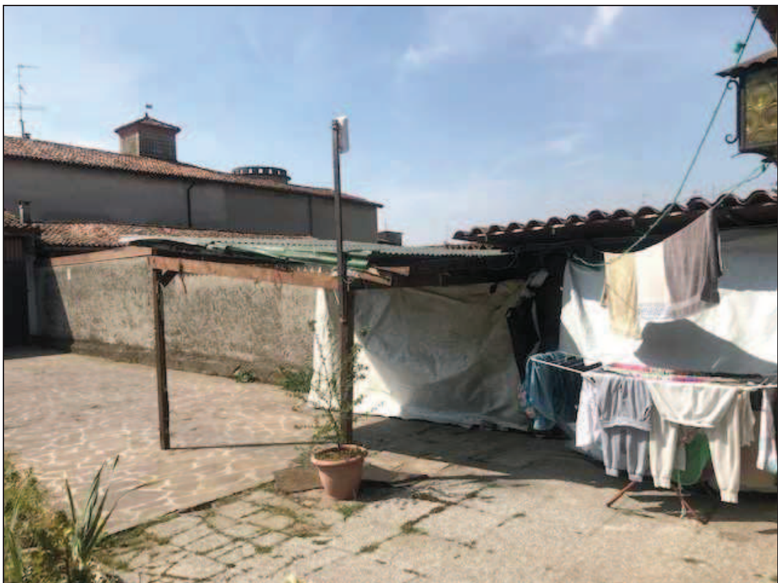
Fotografia 8 – Tettoie/manufatti irregolari sul cortile interno

Immobile in Quinzano d'Oglio (BS), via Giacomo Matteotti n. 37 Catasto Fabbricati foglio NCT/8 particella 131 sub. 10