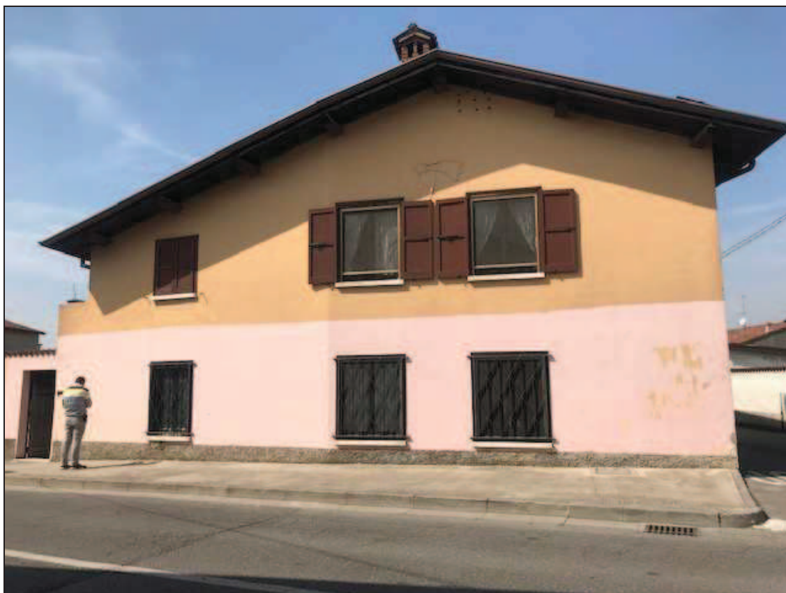
Fotografia 1 – Vista facciata est su via Matteotti