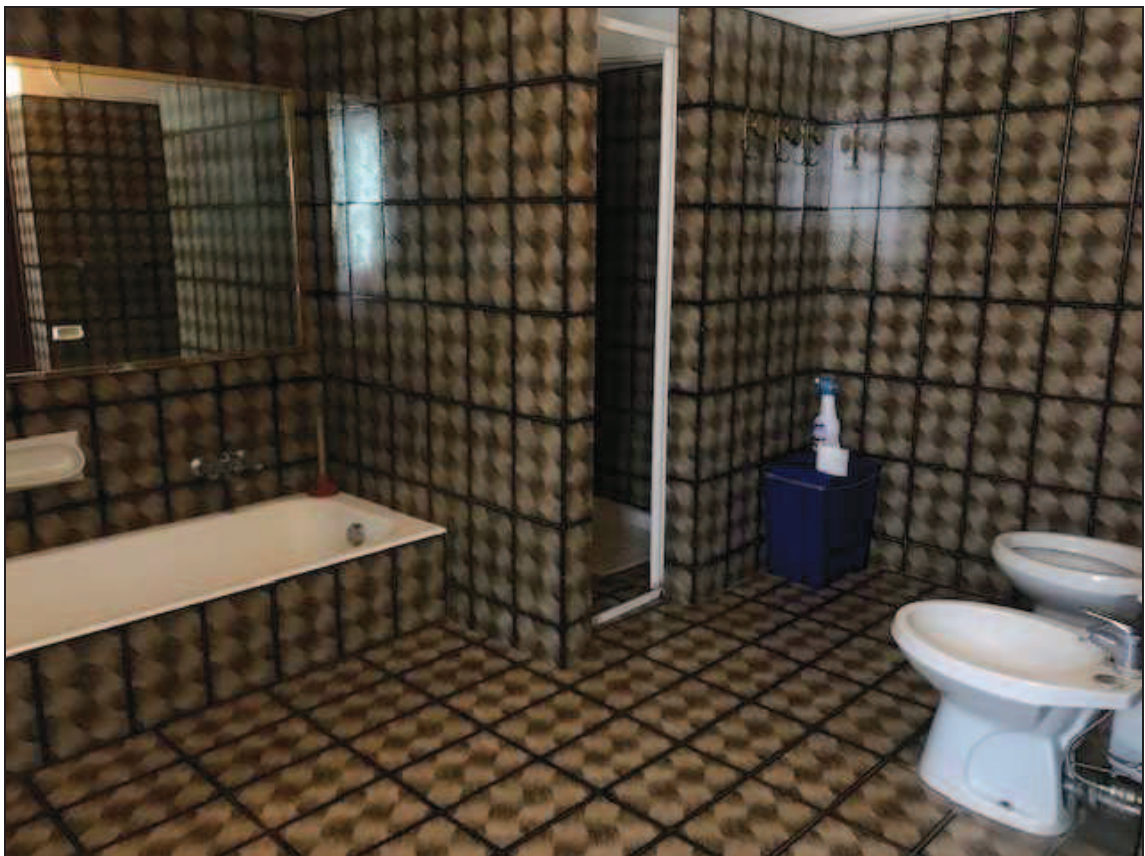
Fotografia 30 – Bagno

Immobile in Quinzano d'Oglio (BS), via Giacomo Matteotti n. 37 Catasto Fabbricati foglio NCT/8 particella 131 sub. 10