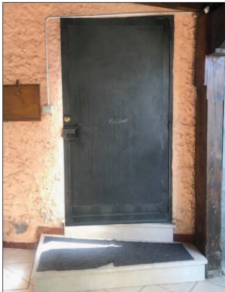
Fotografia 6 – Portoncino pedonale d'ingresso visto dall'interno della veranda

Immobile in Quinzano d'Oglio (BS), via Giacomo Matteotti n. 37 Catasto Fabbricati foglio NCT/8 particella 131 sub. 10