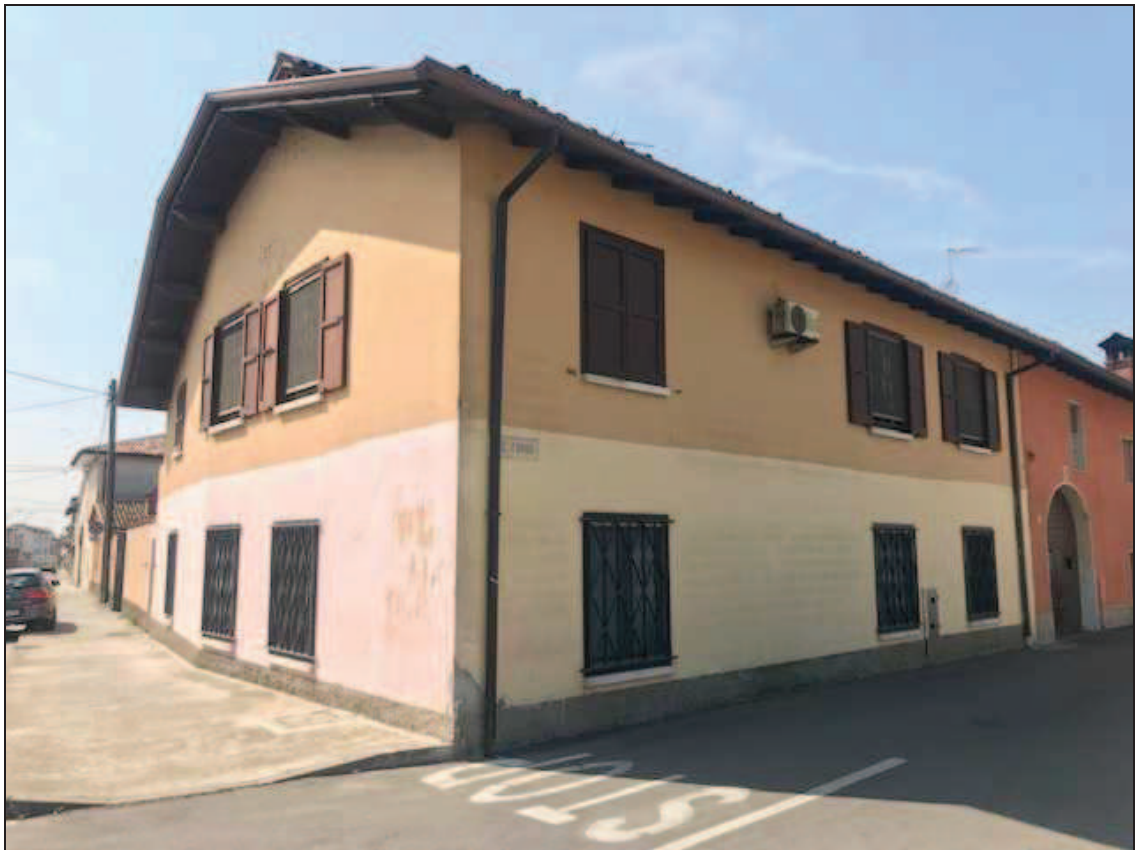
Fotografia 3 – Vista nord-est, angolo via Matteotti – vicolo Forno