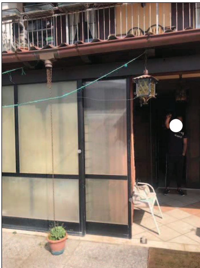
Fotografia 13 – Serramenti scorrevoli di chiusura della veranda