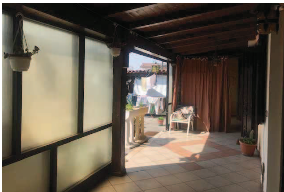
Fotografia 12 – Ancora vista della veranda dall'interno

Immobile in Quinzano d'Oglio (BS), via Giacomo Matteotti n. 37 Catasto Fabbricati foglio NCT/8 particella 131 sub. 10