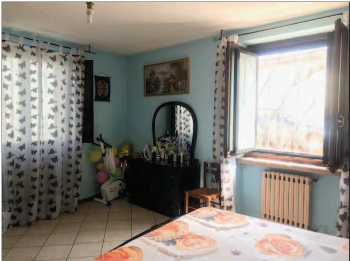
Fotografia 26 – Camera da letto nell'angolo nord-est dell'immobile

Immobile in Quinzano d'Oglio (BS), via Giacomo Matteotti n. 37 Catasto Fabbricati foglio NCT/8 particella 131 sub. 10