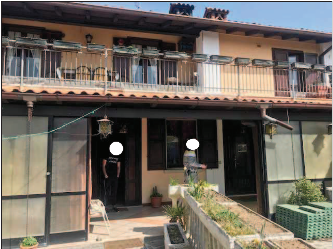
Fotografia 9 – Particolare della vista sud, veranda