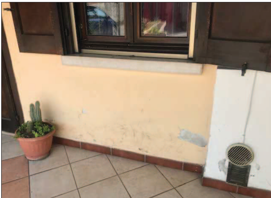
Fotografia 19 – Ancora distacchi di intonaco alla base del muro della facciata sud, per risalita di umidità per capillarità