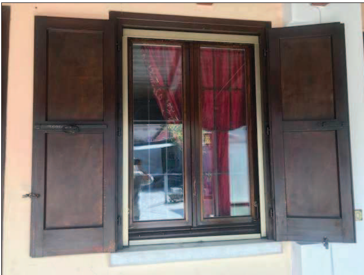
Fotografia 15 – Serramento di una finestra sotto la veranda della facciata sud