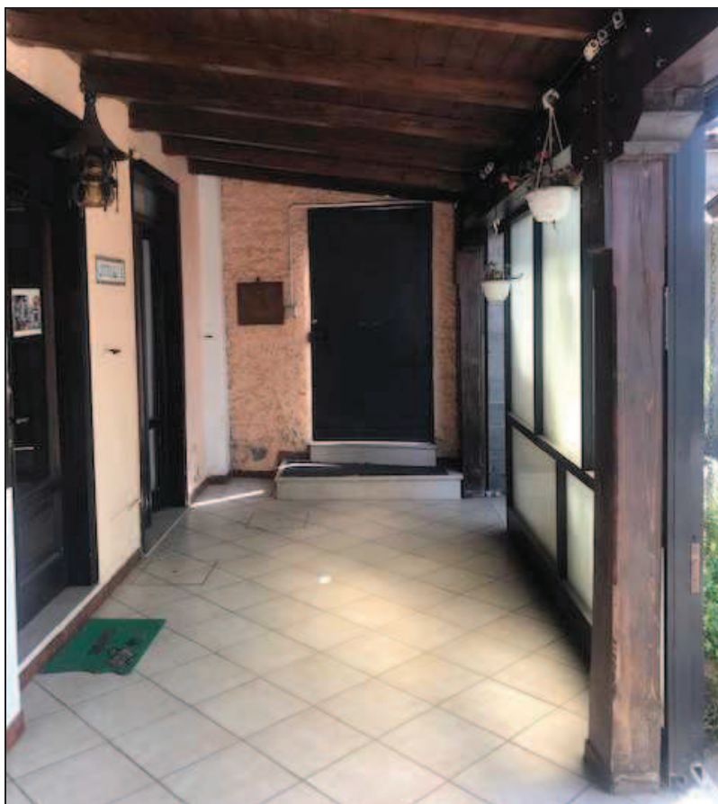
Fotografia 11 – Vista della veranda dall'interno