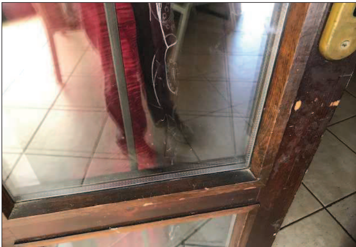
Fotografia 16 – Particolare del serramento di una porta-finestra sulla facciata sud