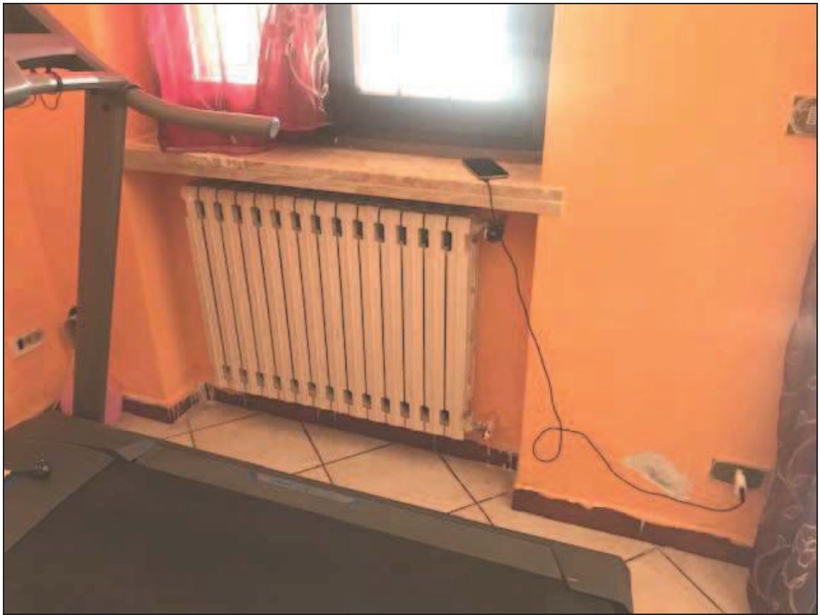
Fotografia 23 – Muro del soggiorno verso la veranda. Si notino i distacchi di intonaco alla sua base causati da risalita di umidità per capillarità