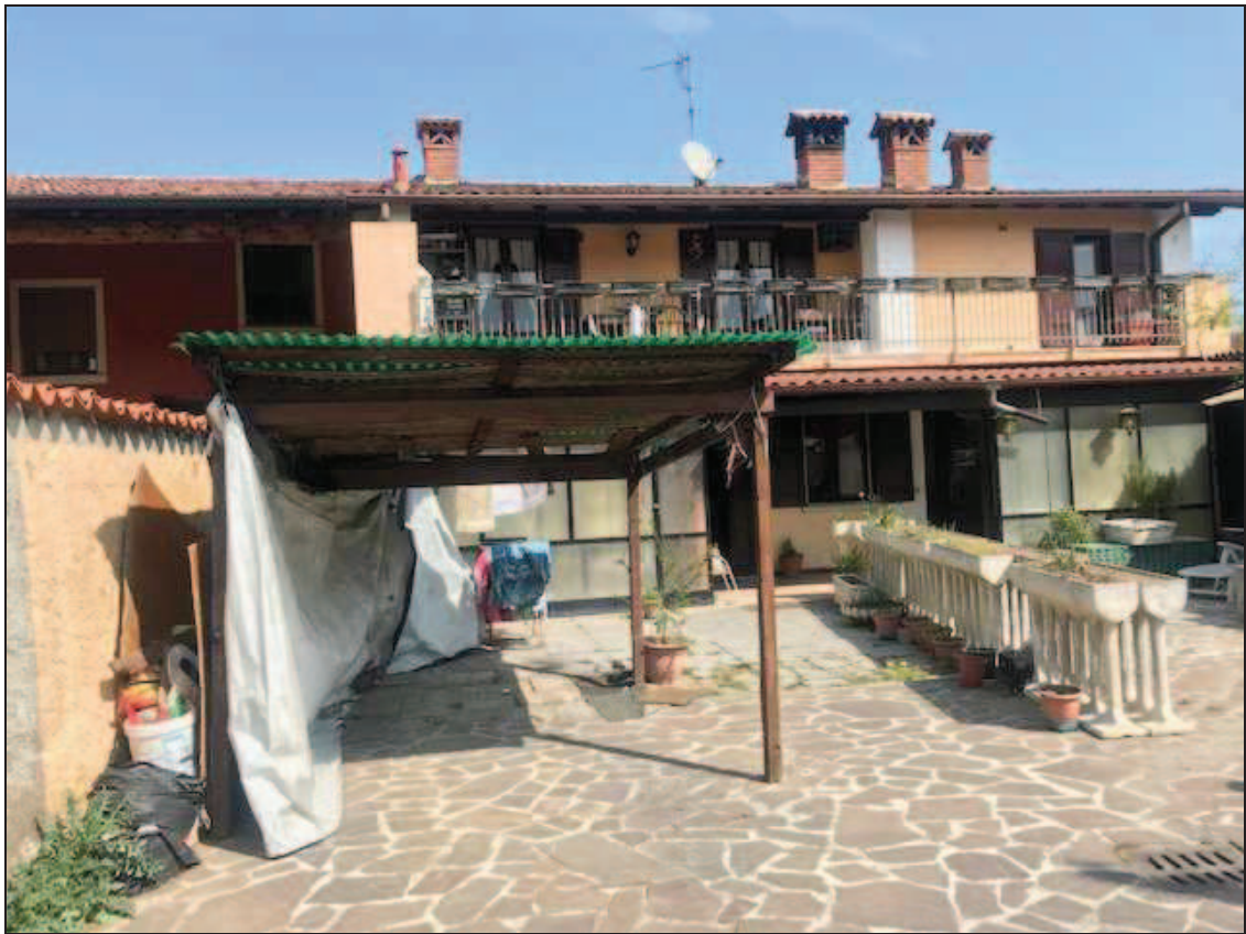
Fotografia 7 – Vista sud, dal cortile interno