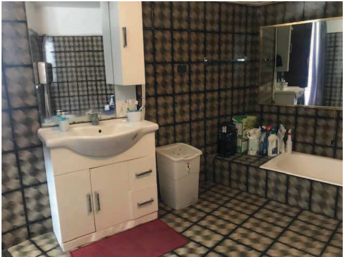
Fotografia 29 – Bagno