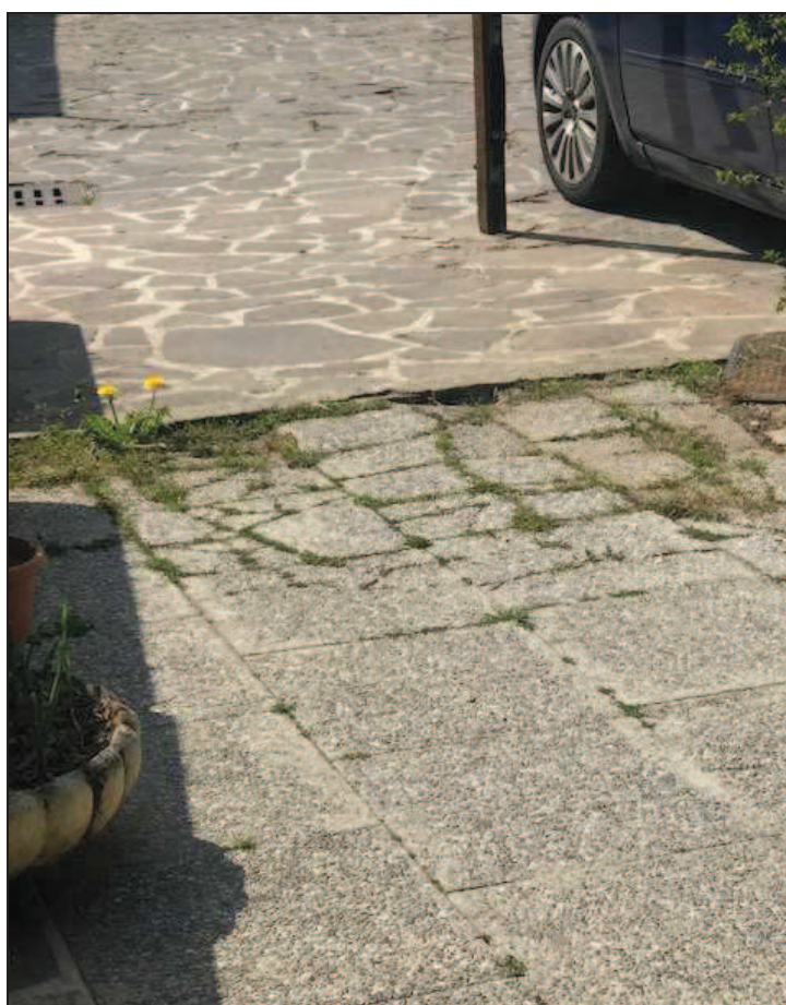
Fotografia 20 – Pavimentazione del cortile interno

Immobile in Quinzano d'Oglio (BS), via Giacomo Matteotti n. 37 Catasto Fabbricati foglio NCT/8 particella 131 sub. 10