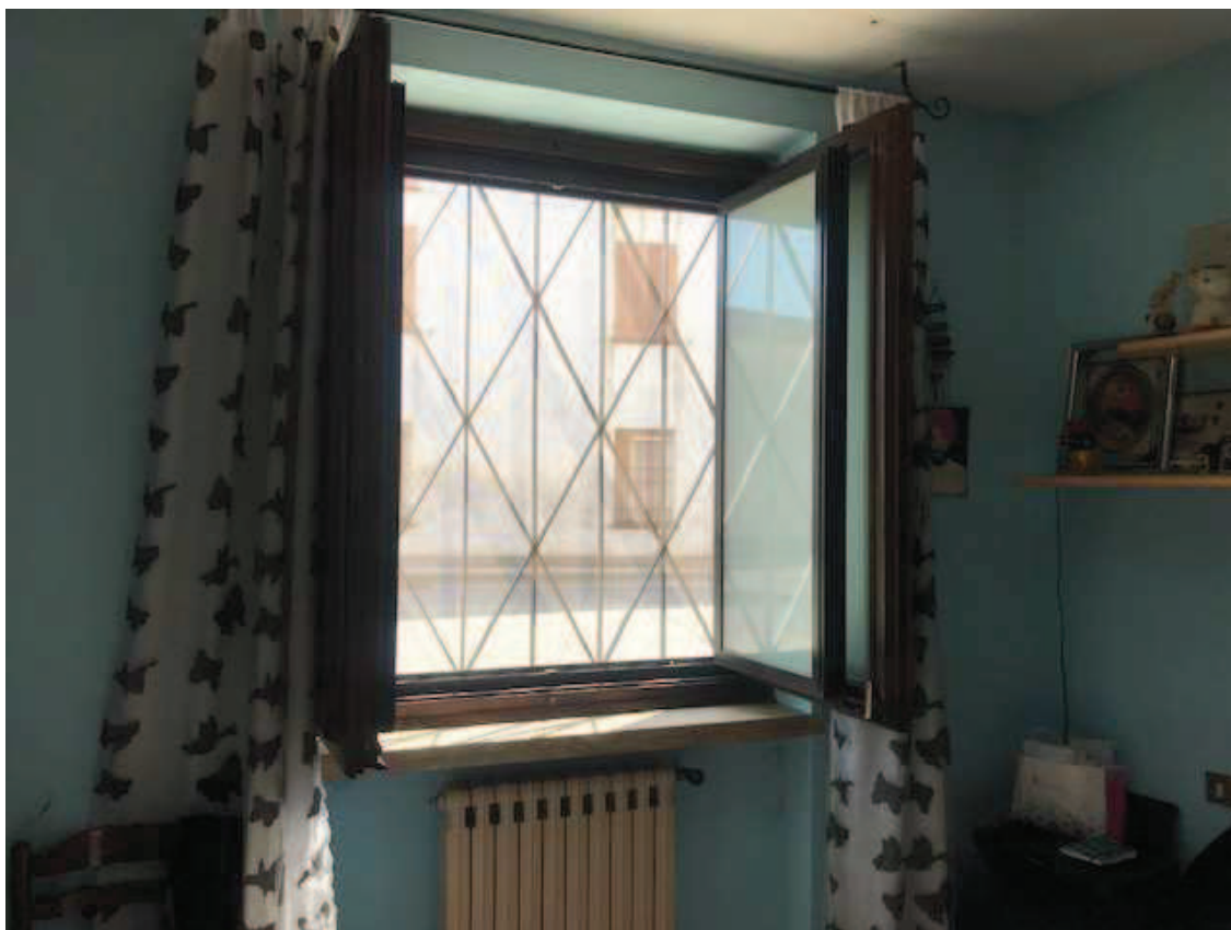
Fotografia 27 – Camera da letto nell’angolo nord-est dell’immobile, particolare del doppio serramento con vetri termici