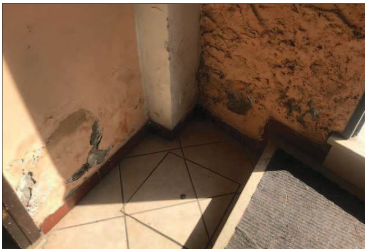
Fotografia 18 – Particolare dei distacchi di intonaco alla base del muro sulla destra del serramento della porta-finestra della foto precedente