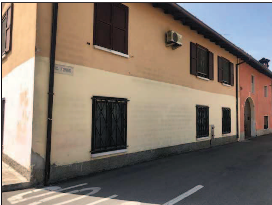
Fotografia 2 – Vista facciata nord su vicolo Forno

Immobile in Quinzano d'Oglio (BS), via Giacomo Matteotti n. 37 Catasto Fabbricati foglio NCT/8 particella 131 sub. 10