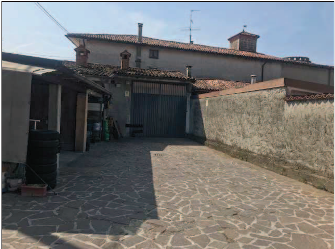
Fotografia 10 – Cortile interno

Immobile in Quinzano d'Oglio (BS), via Giacomo Matteotti n. 37 Catasto Fabbricati foglio NCT/8 particella 131 sub. 10