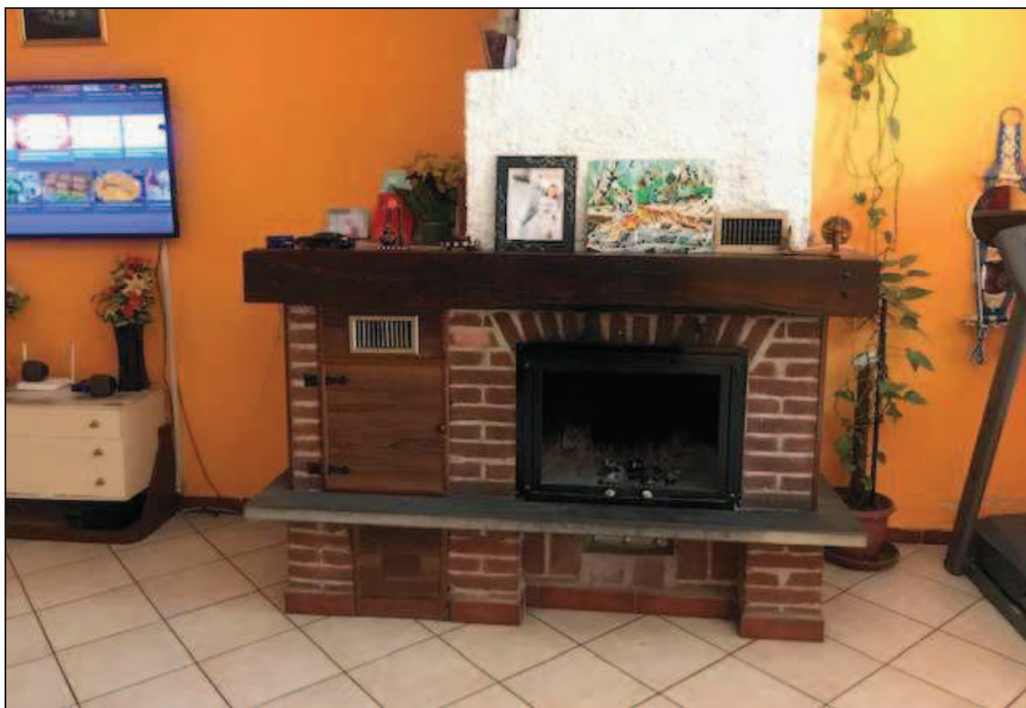
Fotografia 22 – Caminetto nel soggiorno