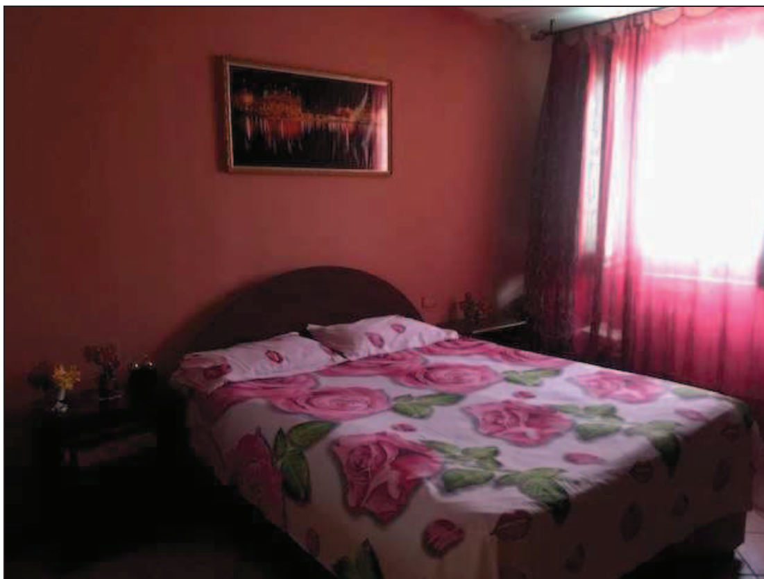
Fotografia 28 – Camera da letto sul lato nord dell’immobile

Immobile in Quinzano d’Oglio (BS), via Giacomo Matteotti n. 37 Catasto Fabbricati foglio NCT/8 particella 131 sub. 10