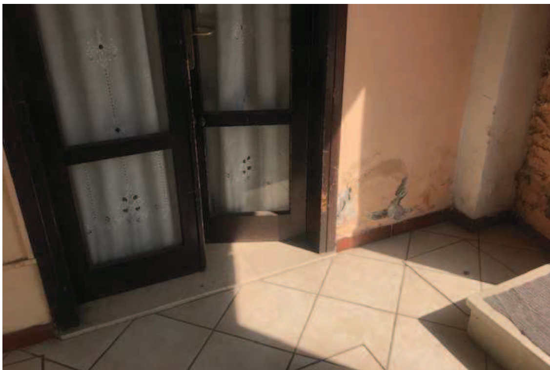
Fotografia 17 – Facciata sud, porta-finestra sotto la veranda, a lato dell'ingresso. Si notino i distacchi di intonaco alla base del muro sulla destra del serramento causati da risalita di umidità per capillarità