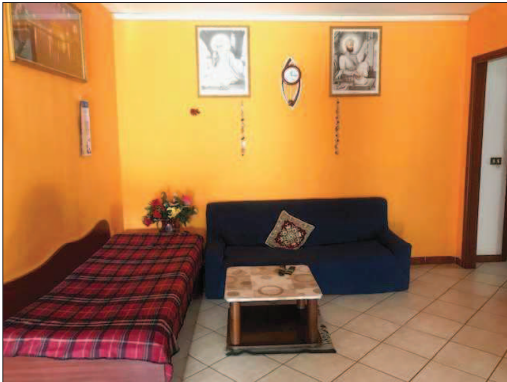
Fotografia 21 – Soggiorno