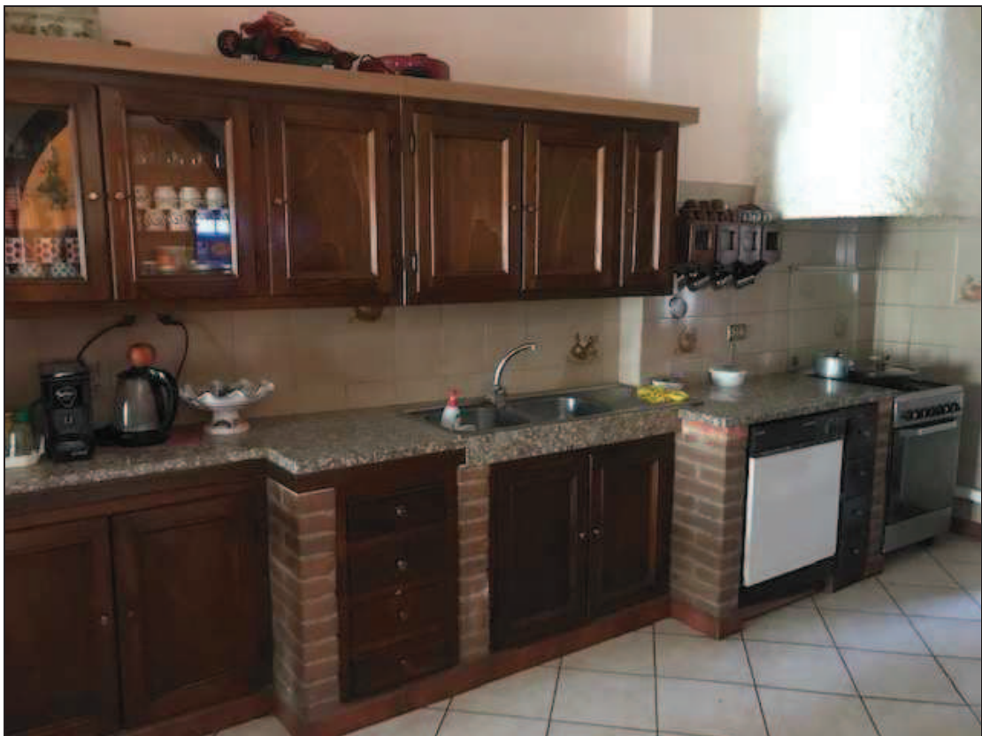
Fotografia 24 – Cucina

Immobile in Quinzano d'Oglio (BS), via Giacomo Matteotti n. 37 Catasto Fabbricati foglio NCT/8 particella 131 sub. 10