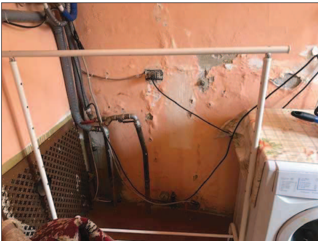
Fotografia 35 – Muro della lavanderia ammalorato dall'umidità