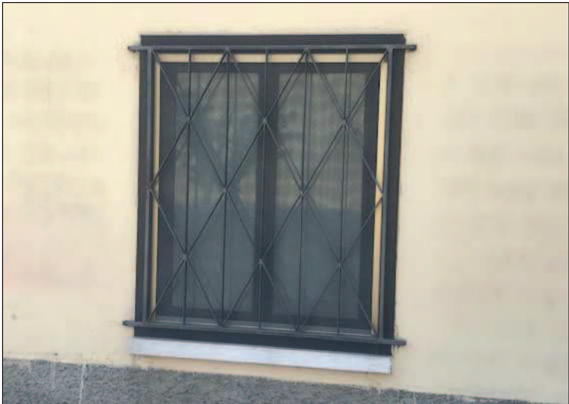
Fotografia 5 – Particolare finestra su facciata nord