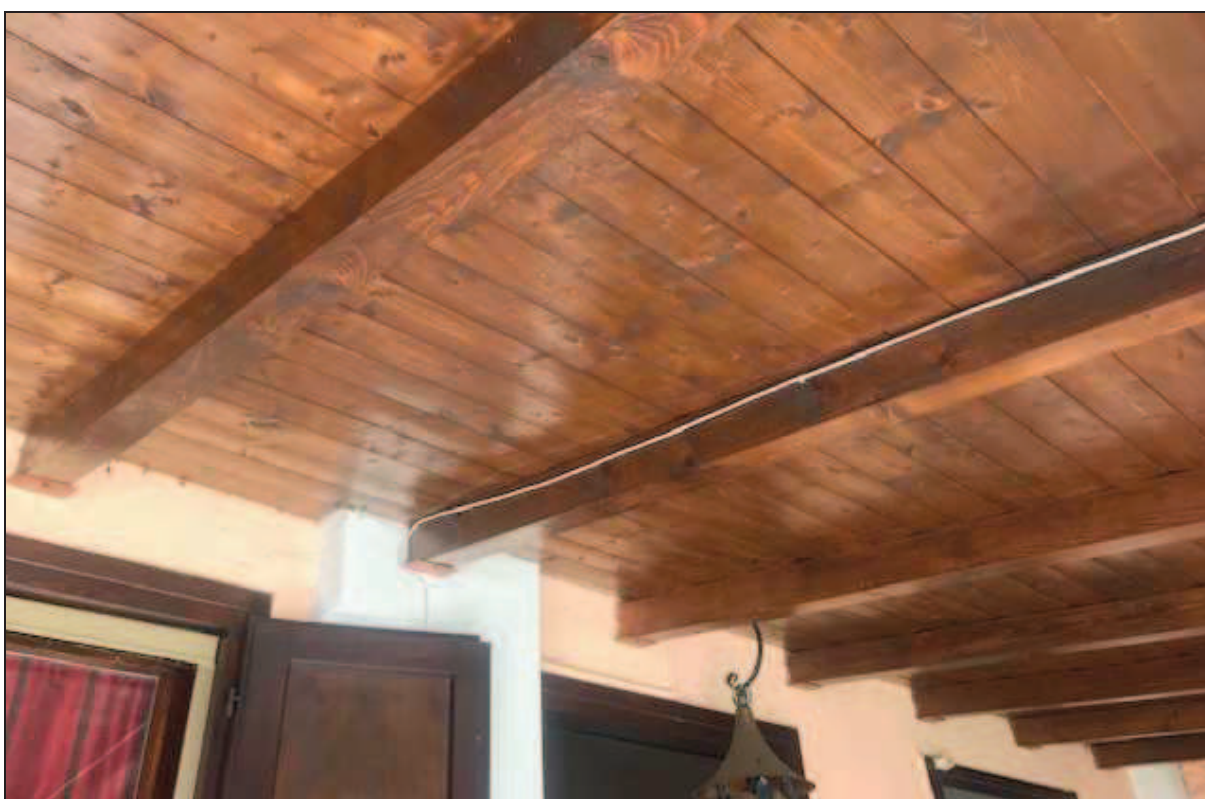
Fotografia 14 – Dettaglio della copertura della veranda

Immobile in Quinzano d'Oglio (BS), via Giacomo Matteotti n. 37 Catasto Fabbricati foglio NCT/8 particella 131 sub. 10