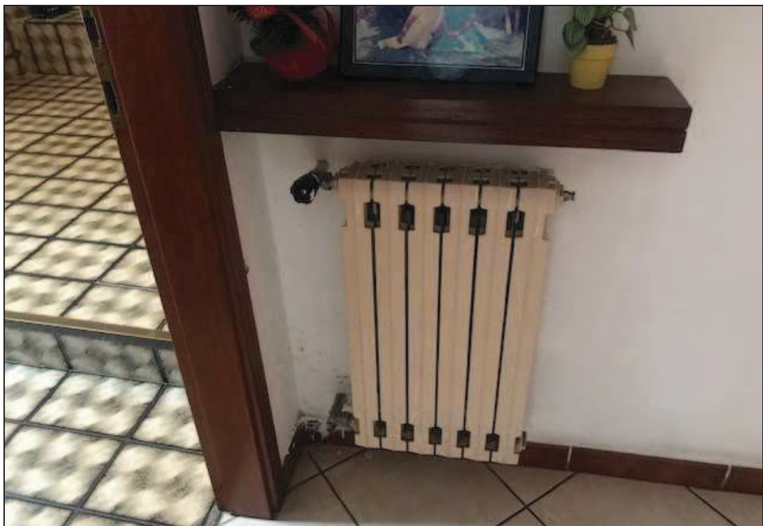
Fotografia 32 – termosifone nel corridoio a lato della porta del bagno