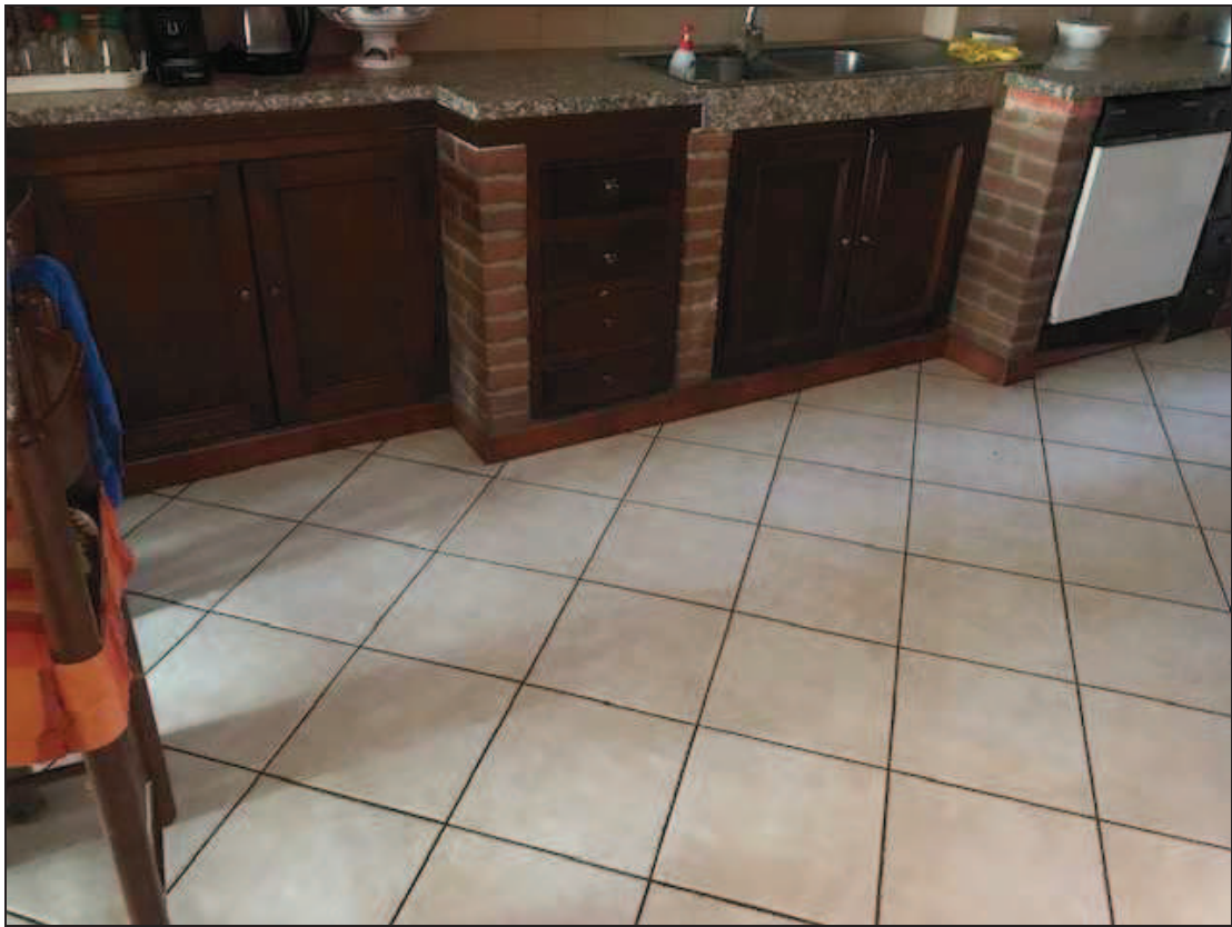
Fotografia 25 – Cucina, particolare del pavimento in ceramica