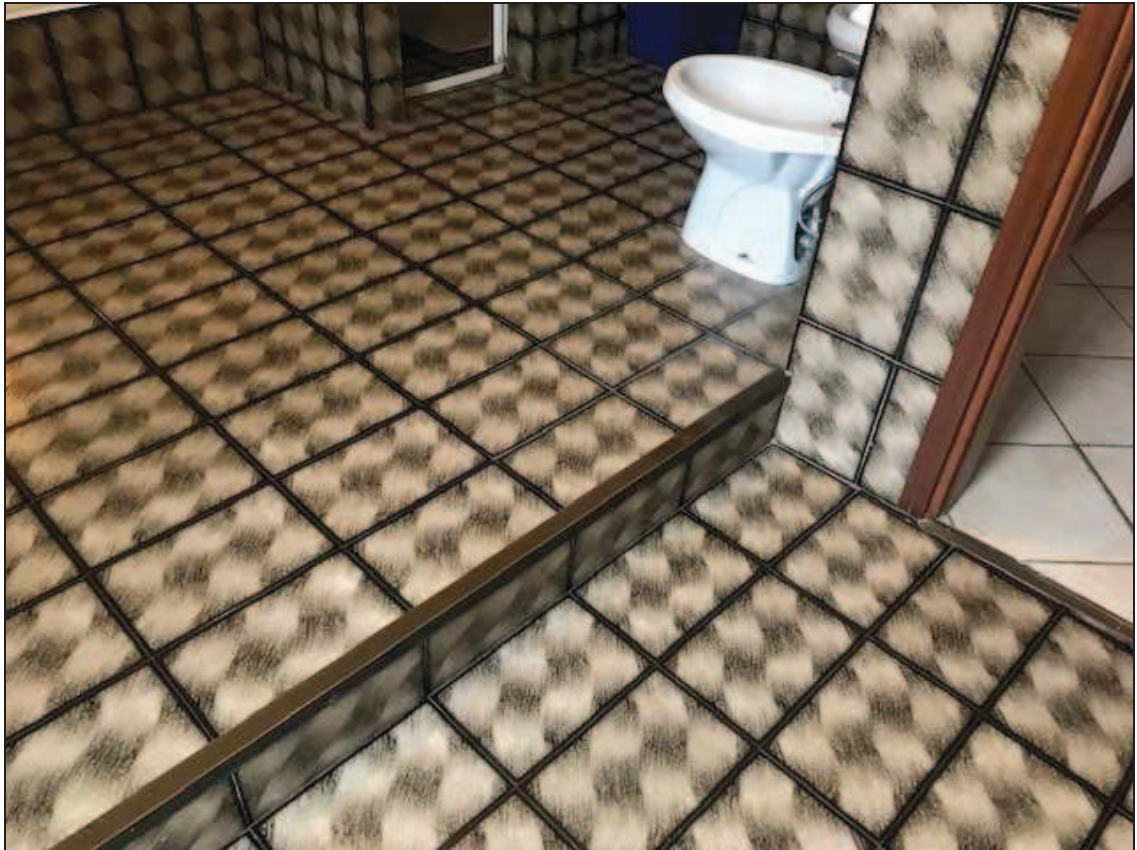
Fotografia 31 – Particolare delle piastrelle del bagno