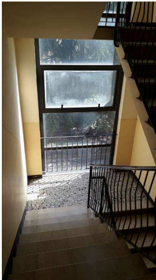
Fotografia 10 – Vano scala comune/3