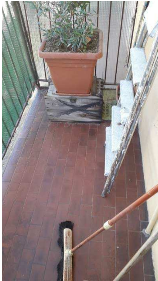
Fotografia 20 – Pavimentazione balcone