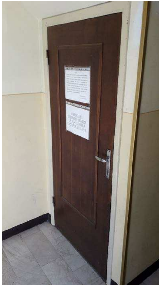
Fotografia 24 – Porta di accesso all'interrato