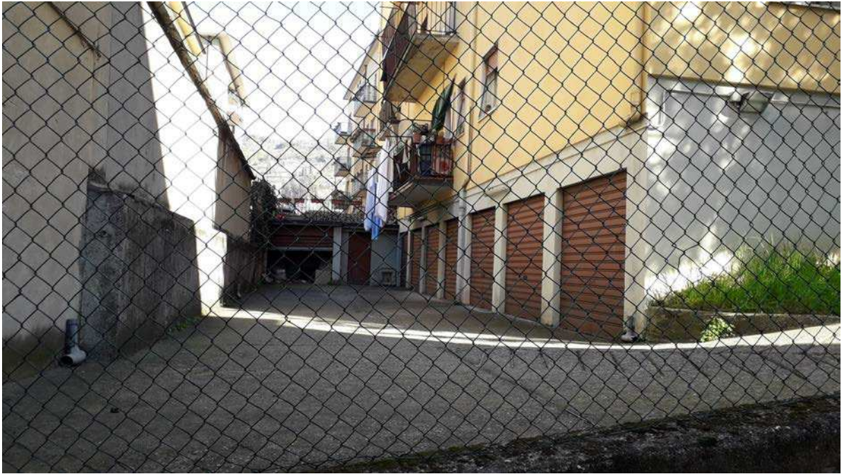
Fotografia 5 – Corte comune