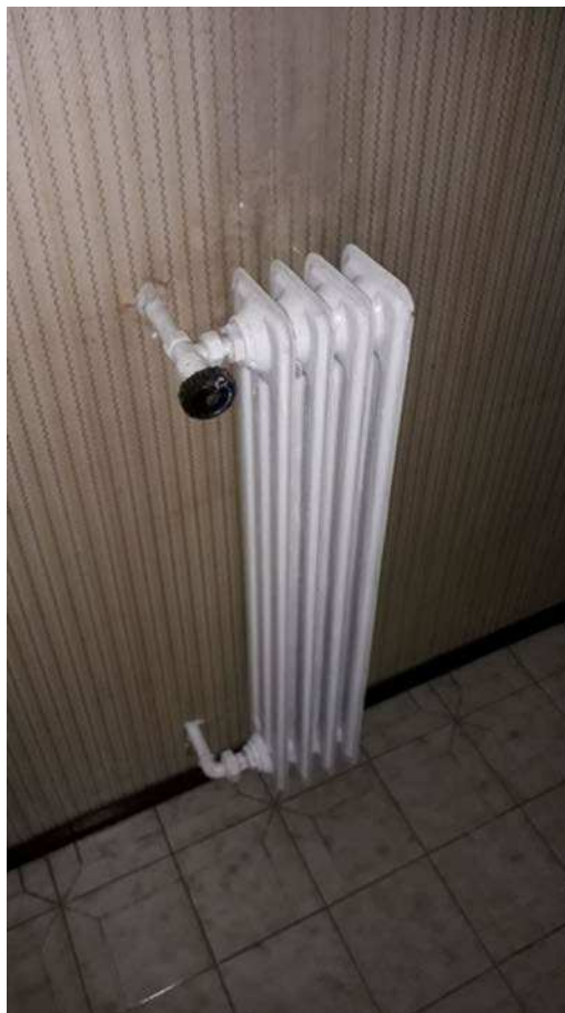
Fotografia 22 – Tipologia terminali emissione calore