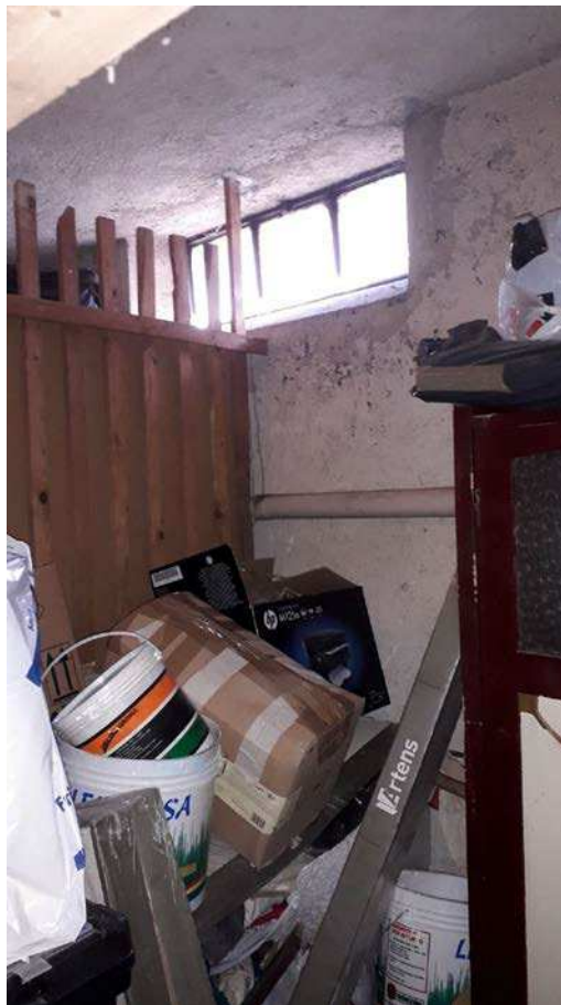
Fotografia 28 – Cantina