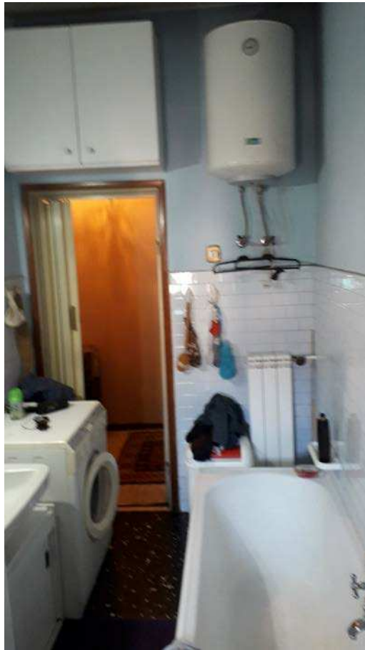
Fotografia 17 – Bagno/3