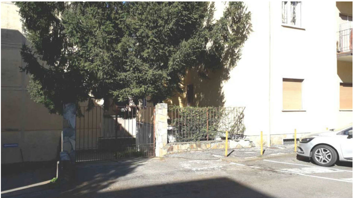
Fotografia 6 – Ingresso carraio al cortile comune