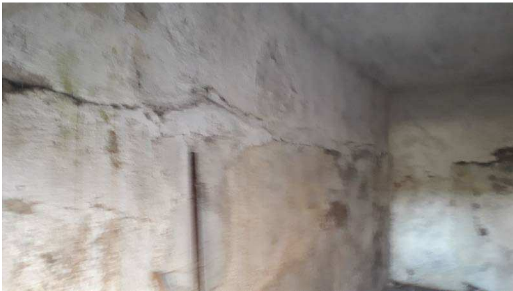
Fotografia 30 – Quadro fessurativo interno