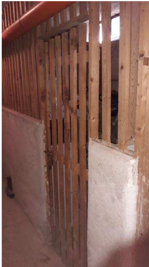
Fotografia 27 – Accesso alla cantina