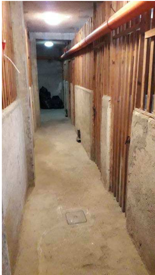
Fotografia 26 – Corridoio comune di accesso alle cantine