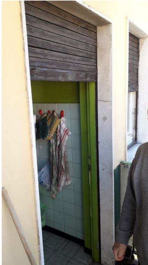
Fotografia 19 – Dettaglio serramenti e infissi/2