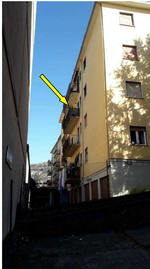
Fotografia 3 – Facciata ovest e unità oggetto di valutazione