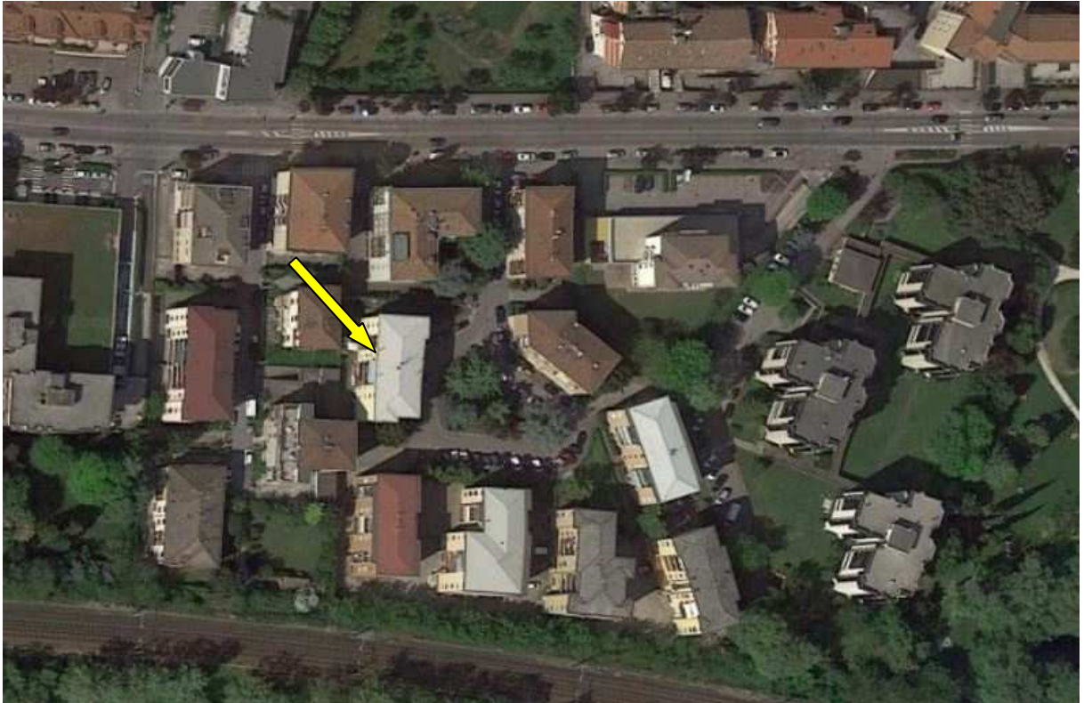
Fotografia 1 – Vista da Google Maps