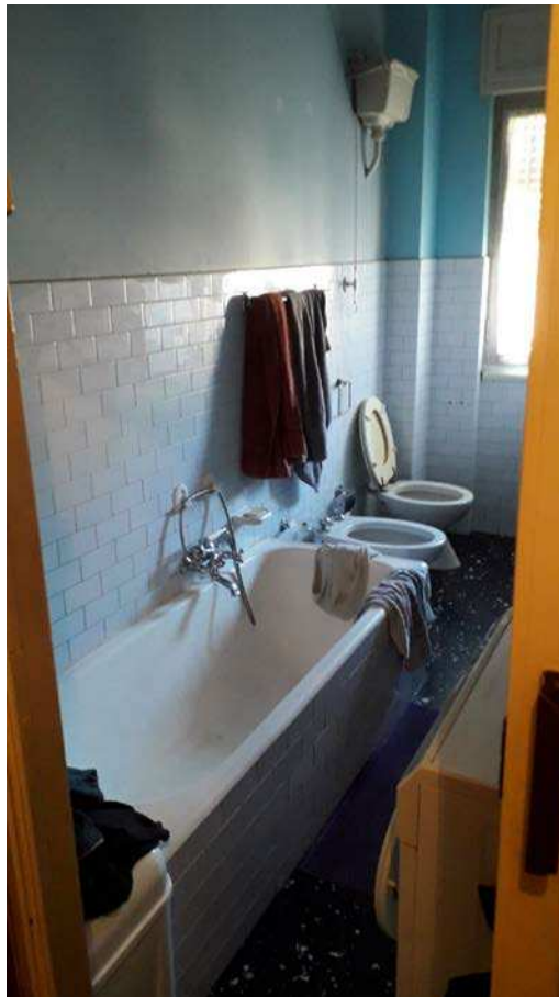
Fotografia 16 – Bagno/2