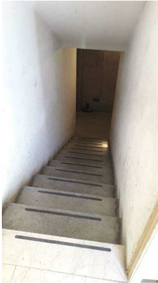
Fotografia 25 – Rampa di accesso all'interrato