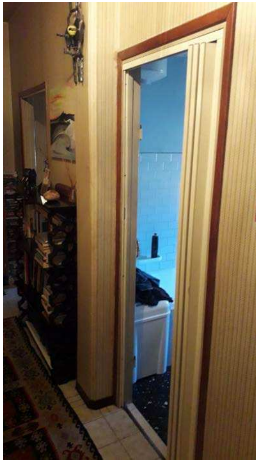
Fotografia 15 – Ingresso al bagno