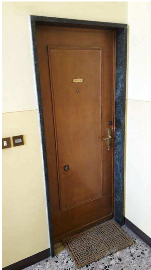
Fotografia 11 – Ingresso all'unità staggiata