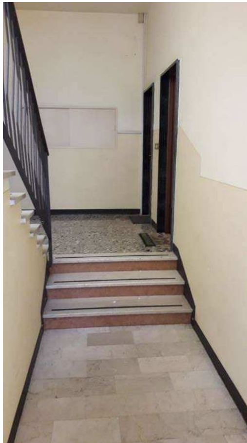
Fotografia 8 – Vano scala comune/1