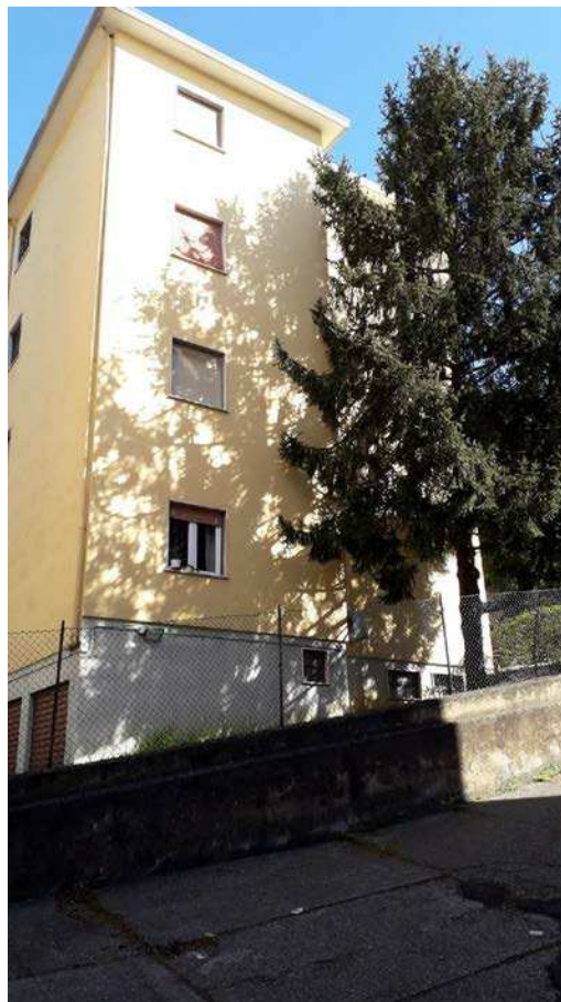
Fotografia 4 – Facciata sud