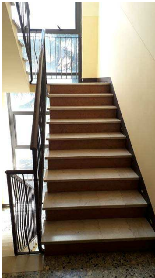
Fotografia 9 – Vano scala comune/2