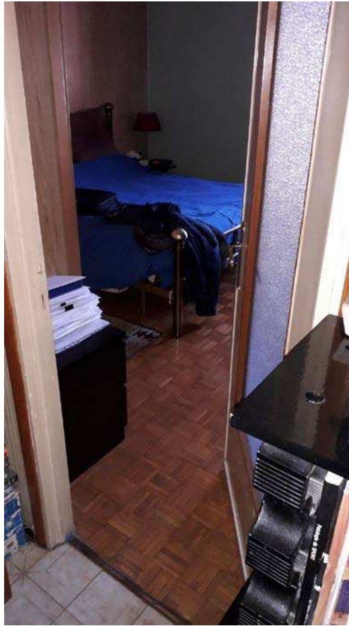
Fotografia 23 – Camera da letto