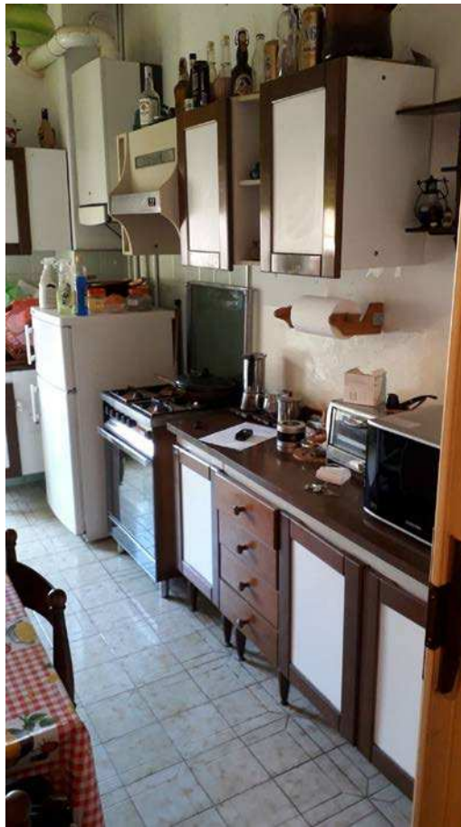
Fotografia 13 – Locale cucina/1