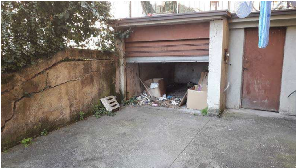
Fotografia 29 – Locali comuni e fessurazione muro di contenimento