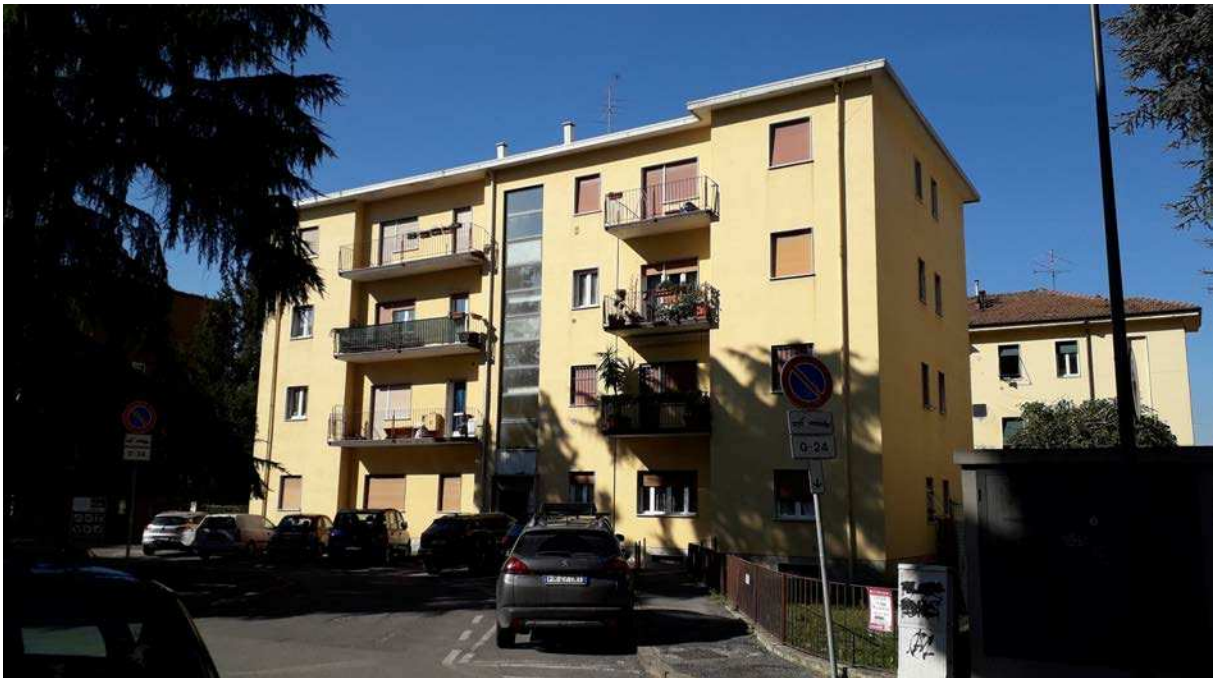
Fotografia 2 – Facciata est (principale) del condominio “Acqua”