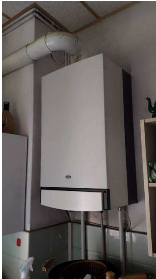
Fotografia 21 – Caldaia posata in cucina