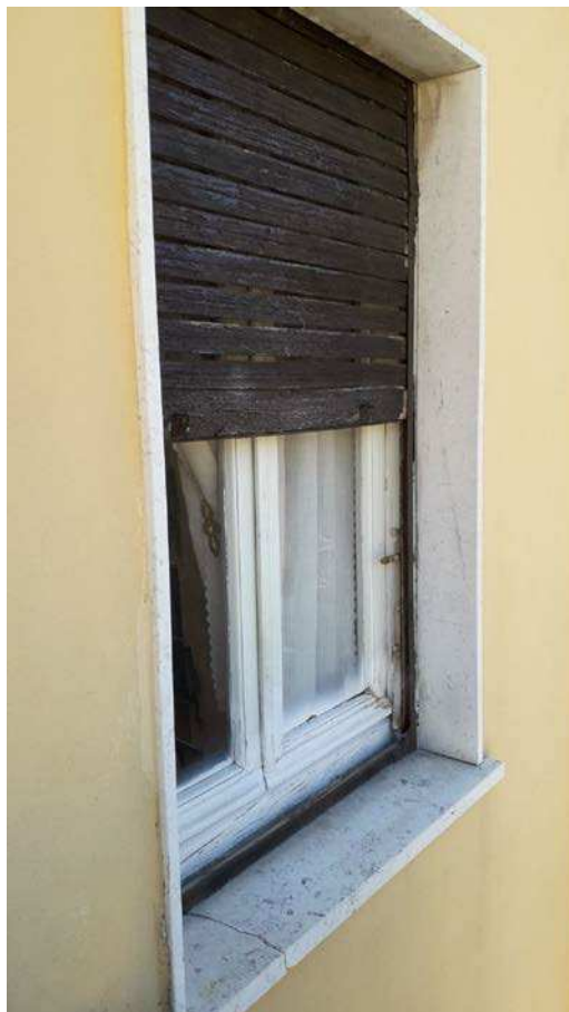
Fotografia 18 – Dettaglio serramenti e infissi/1