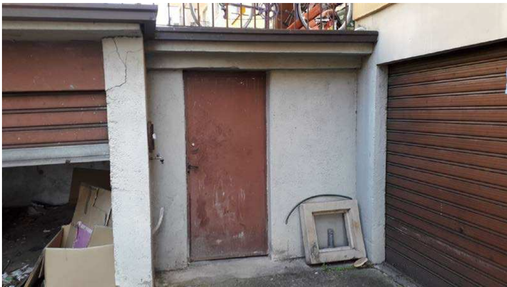
Fotografia 31 – Locali comuni (non accessibile)