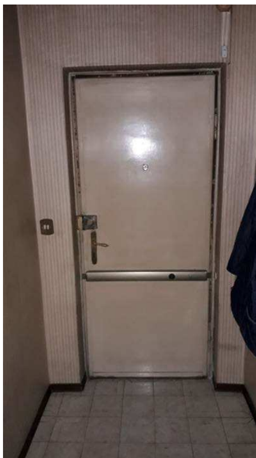
Fotografia 12 – Vista interna porta ingresso